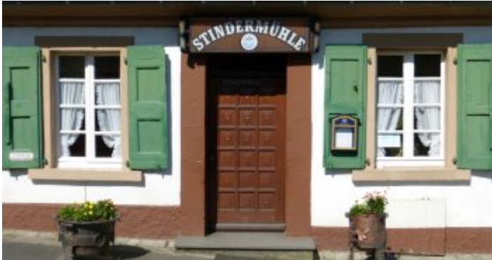
Stinder Mühle – ein Ausflugslokal der ganz alten Schule

Auch hier bildet ein Ausflugslokal den möglichen Ausgangs- oder Endpunkt für eine Wanderung. Wobei: Die Stinder Mühle ist ein Ausflugsort ganz, ganz alter Schule. Am alten Mühlenweiher stehen gegenüber dem Wirtshaus und auf einer Wiese neben dem Teich traditionelle Sitzgelegenheiten. Drinnen sind zwei Tisch mit Wachstuchdecken geschützt. Zur Küche hin steht eine Theke wie es sie in Eckkneipen schon ganz lange nicht mehr gibt. Und der Kuchen ist lecker, weil selbstgemacht. Das gilt auch für die Hausmannskost, die es in der kühleren Jahreszeit gibt. Der Wanderweg A2 führt zunächst am Bach entlang hoch auf die Hügel des Bergischen Landes. Dann geht es quer durch die Landwirtschaft und anschließend wieder runter – wobei man leider ein ganzes Stück entlang einer Fahrstraße zurücklegen muss, die zu den üblichen Zeiten heftig von Autofahrern auf dem Weg zum Reiten oder dem Rückweg frequentiert wird. Insgesamt legt man so 7,4 Kilometer zurück.