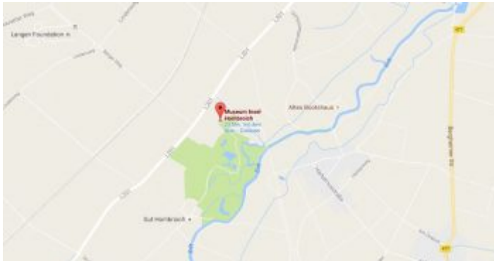
Google-Map: Museumsinsel Hombroich

Schon seit einiger Zeit gehört auch die ehemalige Raketenstation „Kapellen“, die von den belgischen Streitkräften im Auftrag der NATO gehalten wurde, zur Gesamtanlage. Dieses Gelände beherbergt nun die Langen Foundation mit ihrem atemberaubenden Bau des japanischen Architekten Tadao Ando . Hundefreunde dürfen traurig sein, denn Fiffi und Hasso dürfen nicht mit aufs Gelände der Museumsinseln Hombroich. In kaum einer Stunde schafft man es aus der Stadt per Velo nach Hombroich. Nicht ganz leicht zu finden ist der Weg von der Erftmündung entlang des Flusses. Einfacher, aber nicht besonders hübsch ist die Tour entlang der B326 und der B1 bis nach Holzheim.