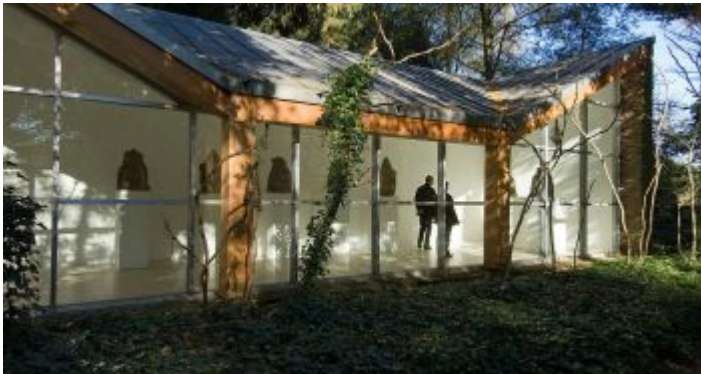
Insel Hombroich – Kunst, wo man hinschaut