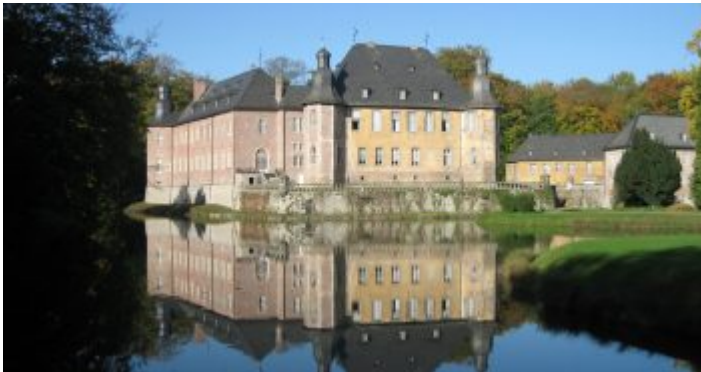
Schloss Dyck – die Burg im Wasser

Wer als Pflanzen- und/oder Gartenfreund bei einem Ausflug nach Schloss Dyck nur durch den ausgedehnten, herrlich angelegten Park wandelt, verpasst das Beste. Zwar hat man dann einen feinen Spaziergang unter Bäumen samt tollem Blick auf das imposante Wasserschloss genossen, aber die Gartenschau gleich beim Eingangskomplex verpasst. Die allein ist das ziemlich heftige Eintrittsgeld von 9,00 Euro wert (für Erwachsene; ermäßigt 6,00 Euro; Kinder von 7-16 Jahren 1,50 Euro; Kinder unter 7 Jahren frei). Legendär sind die sachkundigen Führungen ( PDF-Link ) durch Park und Gärten und natürlich die regelmäßigen Tages- und Abendveranstaltungen.