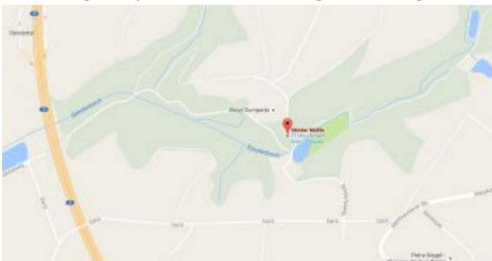
Google-Map: Stinder Mühle

Auch hier bildet ein Ausflugslokal den möglichen Ausgangs- oder Endpunkt für eine Wanderung. Wobei: Die Stinder Mühle ist ein Ausflugsort ganz, ganz alter Schule. Am alten Mühlenweiher stehen gegenüber dem Wirtshaus und auf einer Wiese neben dem Teich traditionelle Sitzgelegenheiten. Drinnen sind zwei Tisch mit Wachstuchdecken geschützt. Zur Küche hin steht eine Theke wie es sie in Eckkneipen schon ganz lange nicht mehr gibt. Und der Kuchen ist lecker, weil selbstgemacht. Das gilt auch für die Hausmannskost, die es in der kühleren Jahreszeit gibt. Der Wanderweg A2 führt zunächst am Bach entlang hoch auf die Hügel des Bergischen Landes. Dann geht es quer durch die Landwirtschaft und anschließend wieder runter – wobei man leider ein ganzes Stück entlang einer Fahrstraße zurücklegen muss, die zu den üblichen Zeiten heftig von Autofahrern auf dem Weg zum Reiten oder dem Rückweg frequentiert wird. Insgesamt legt man so 7,4 Kilometer zurück.