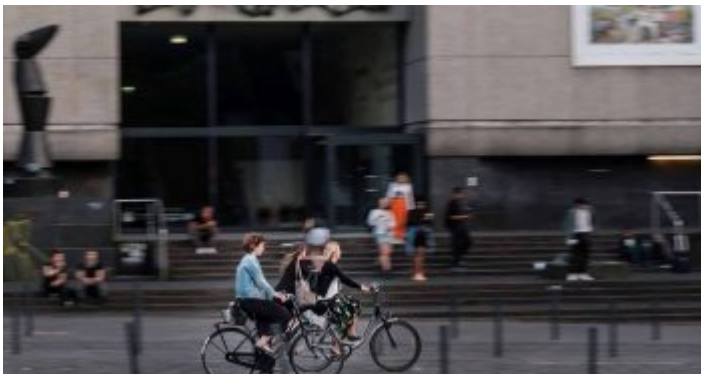
Vor der Kunsthalle am Grabbeplatz

Bis Mitte der Sechziger Jahre war der Grabbeplatz zwischen Heinrich-Heine-Allee und Mühlenstraße von mehr oder weniger nutzbaren Ruinen umgeben. Schon lange war geplant, die Reste der alten Kunsthalle abzureißen und einen zeitgemäßen Neubau an seiner Stelle zu errichten. 1967 wurde dann der quadratisch-praktische Würfel im Stile des Brutalismus