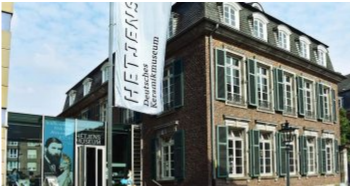
Das Hetjens Deutsches Keramikmuseum im Palais Nesselrode