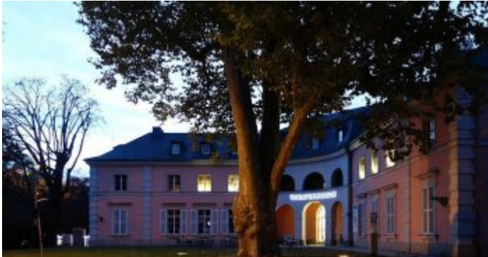
Das Theatermuseum öffnet sich zum Hofgarten