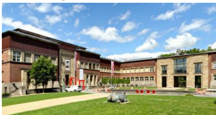
Der Kunstpalast im Ehrenhof mit dem West- und Ostflügel

Das ehemalige Kunstmuseum Düsseldorf nimmt den größten Teil des Ehrenhofs ein, dessen Westflügel zum Teil aus umgebauten Elementen des an dieser Stelle im 19. Jahrhundert erbauten Kunstpalastes besteht. Bekanntlich wurde das ganze Ensemble aus Rheinterrasse, Rheinhalle (heute: Tonhalle) und Ehrenhof zur berühmten Ausstellung Gesolei im Jahr 1926 errichtet. Bis 2001 betrieb die Stadt diesen Museumskomplex mit der Sammlung im Westflügel und speziell für Ausstellungen Düsseldorfer Künstler genutzten Ostflügel – bekannt vor allem durch die sogenannte „ Große Kunstausstellung „. Besonders dieser Teil war einigermaßen marode und nur teilweise nutzbar; so entschloss sich die Stadt zu einer Privat-Public-Partnership mit der E.ON und der Metro-Group, die Mittel für den grundlegenden Umbau erbrachte. Im Gegenzug durfte die E.ON ein städtisches Grundstück in unmittelbarer Nachbarschaft des Museums, das eigentlich nicht als Bauland vorgesehen war, für einen Neubau nutzen.