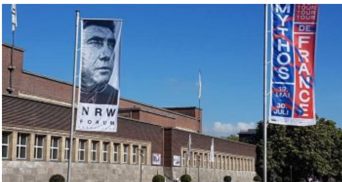
Das NRW Forum im Ehrenhof – mehr Pop als alles andere

Wer seine Kindheit und Jugend im Düsseldorf der Sechzigerjahre verbracht hat, erinnert sich wehmütig an das sogenannte „Wirtschaftsmuseum“, das in Wahrheit „Landesmuseum Volk und Wirtschaft“ hieß. In allen Ferien musste man einmal dorthin, auch wenn man die vielen Exponate, vor allem die interaktiven Dinge und den nachgebauten Bergwerksstollen im Keller in- und auswendig kannte. Über viele Jahre änderte sich nichts im Südwestgebäude des Ehrenhofs, deshalb blieben nach und nach die Besucher weg, und dann fiel das Museum dem Sparkurs der Stadt zum Opfer. Nach einer umfassenden Renovierung wurde dann das „NRW Forum Kultur und Wirtschaft“ in Kooperation von Stadt und Land eröffnet. Nun sollten