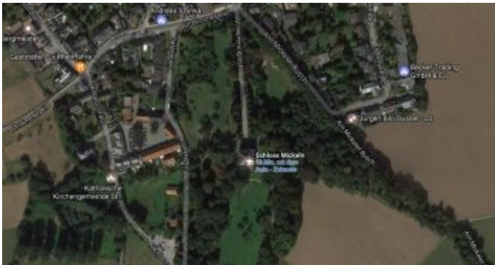
Schlosspark Mickeln