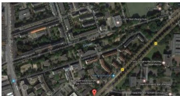
Google-Map: Die Düssel an der Feuerbachstraße

Ganz unnötig finde ich persönlich die Namensgebung für das Stück Grün entlang der Düssel an der Feuerbachstraße zwischen Mecumstraße und dem Hennekamp. Wie ich als Gastbeitrag beim Düssel-Flaneur schon schrieb: Für uns heißt die Anlage nur „Die Düssel“. Übrigens hat sie eine merkwürdige Entstehungsgeschichte. Wie man auch im weiteren