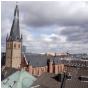
So schief ist der Lambätes gar nicht...