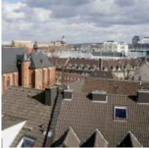
Altstadtdächer (Blick aus dem Schlossturm)