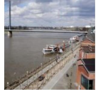
Blick in Richtung Oberkasseler Brücke