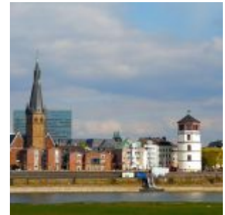
Dä Lambätes un dä Schlossturm

Da lacht der Unwissende: Wie jetzt, der Schlossturm ist doch kaum dreikäsehoch, wie soll man da einen Blick auf Düsseldorf von oben haben? Pustekuchen. Zwar reicht der Blick aus dem Laternchen im obersten Stockwerk kaum bis zum Grafenberger Wald, dafür hat man aber einen herrlichen Blick auf die Altstadt, den Burgplatz und die Rheinuferpromenade. Außerdem ist der Schlossturm gut zugänglich, weil er das Schifffahrtsmuseum beherbergt. Möchte man oben in diesem angenehmen Café mit der sehr freundlichen Bedienung seinen Kaffee nehmen und den Ausblick genießen, muss man allerdings den Eintritt für das Museum bezahlen. Der beträgt 3,00 Euro (ermäßigt 1,50); Kinder und Jugendliche bis zum vollendeten 18. Lebensjahr haben freien Eintritt. Mit den Einnahmen wird übrigens der Bestand des hochinteressanten Museums erhalten, sodass die drei Euro für einen guten Zweck angelegt sind.