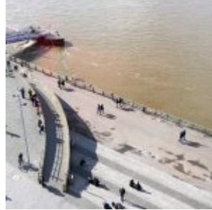
Untere Rheinwerft, gesehen aus der Laterne im Schlossturm