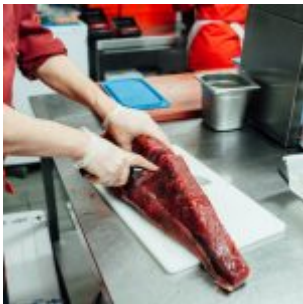
Huji schneidet Tunfisch