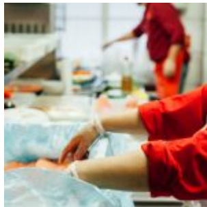
Nazifa packt Lachs aus