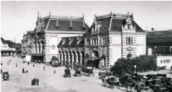
Der alte Hauptbahnhof

Glashütte, William Thomas Mulvany, den Gründervater des Ruhrkohlebergbaus, und Albert Poensgen, den Eisen- und Stahlunternehmer aus der Eifel. Die Industrialisierung sorgte wiederum für ein extremes Wachstum zwischen 1860 und 1890, das zum Neubau ganzer Stadtviertel (z.B. Friedrichstadt), zur Bebauung landwirtschaftlicher Flächen auf dem Stadtgebiet und zu Eingemeindungen führte.