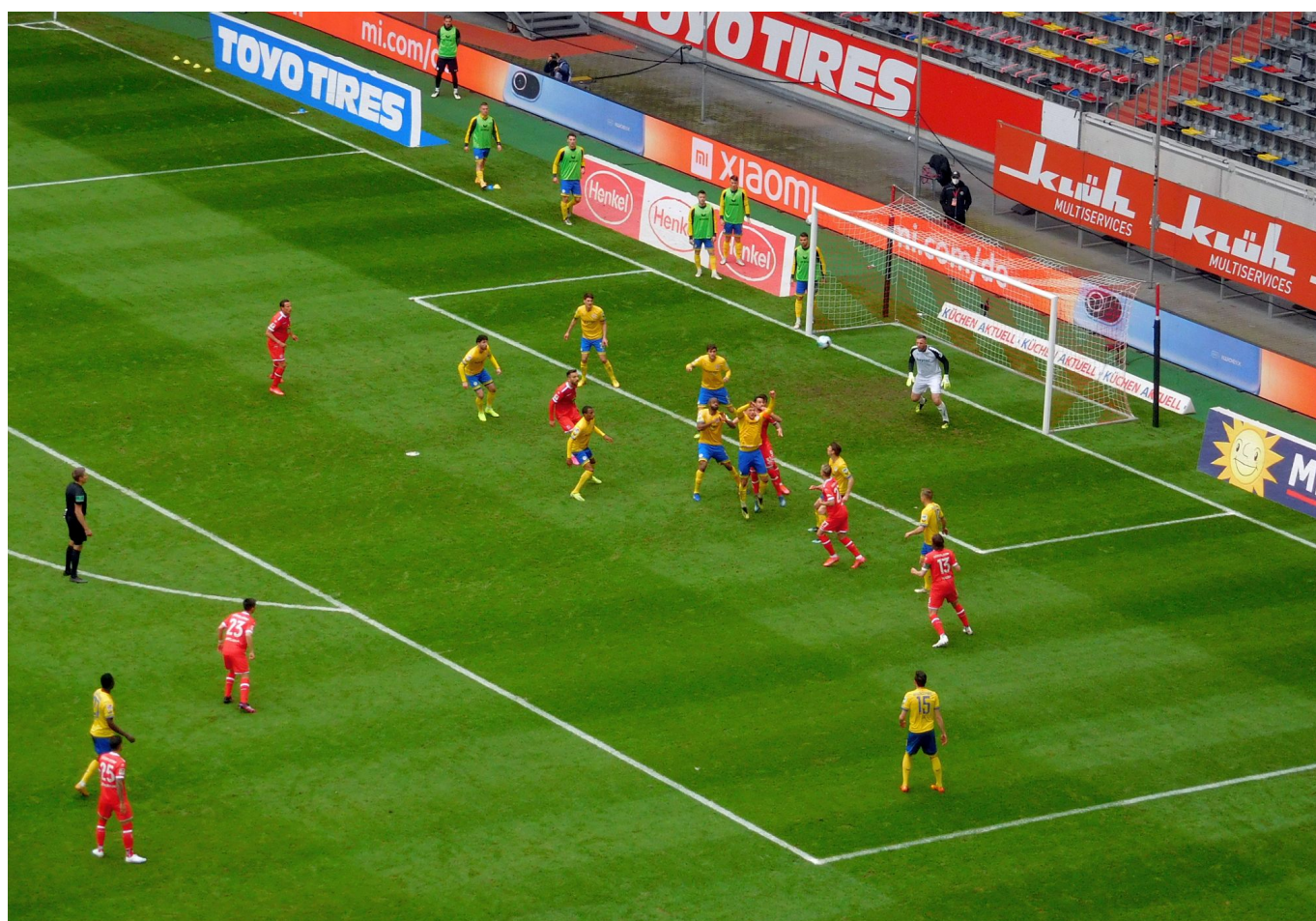
F95 vs BTSV: Brotlose Strafraumszene gegen Ende

Aber: Auch das bisschen Flanken, das Brandon Borrello liefert, fand eben zu selten unseren Kownacki. Man kann zusammenfassen auch sagen: Den begabten, aber auch schnell in Frust versinkenden Dawid in einem solchen System als einzige Spitze aufzubieten, ist eine Scheißidee. Überhaupt ist inzwischen die größte Sorge Ihres in Ehren ergrauten Analysten, dass Uwe Rösler und sein Team ein paar Spieler sauer fahren. Und zwar entweder genau dadurch, dass sie nicht ihren Fähigkeiten entsprechend eingesetzt und positioniert werden oder dass sie zu selten oder nie oder zu spät eingewechselt werden. [Spielbericht vom 09.05.2021]