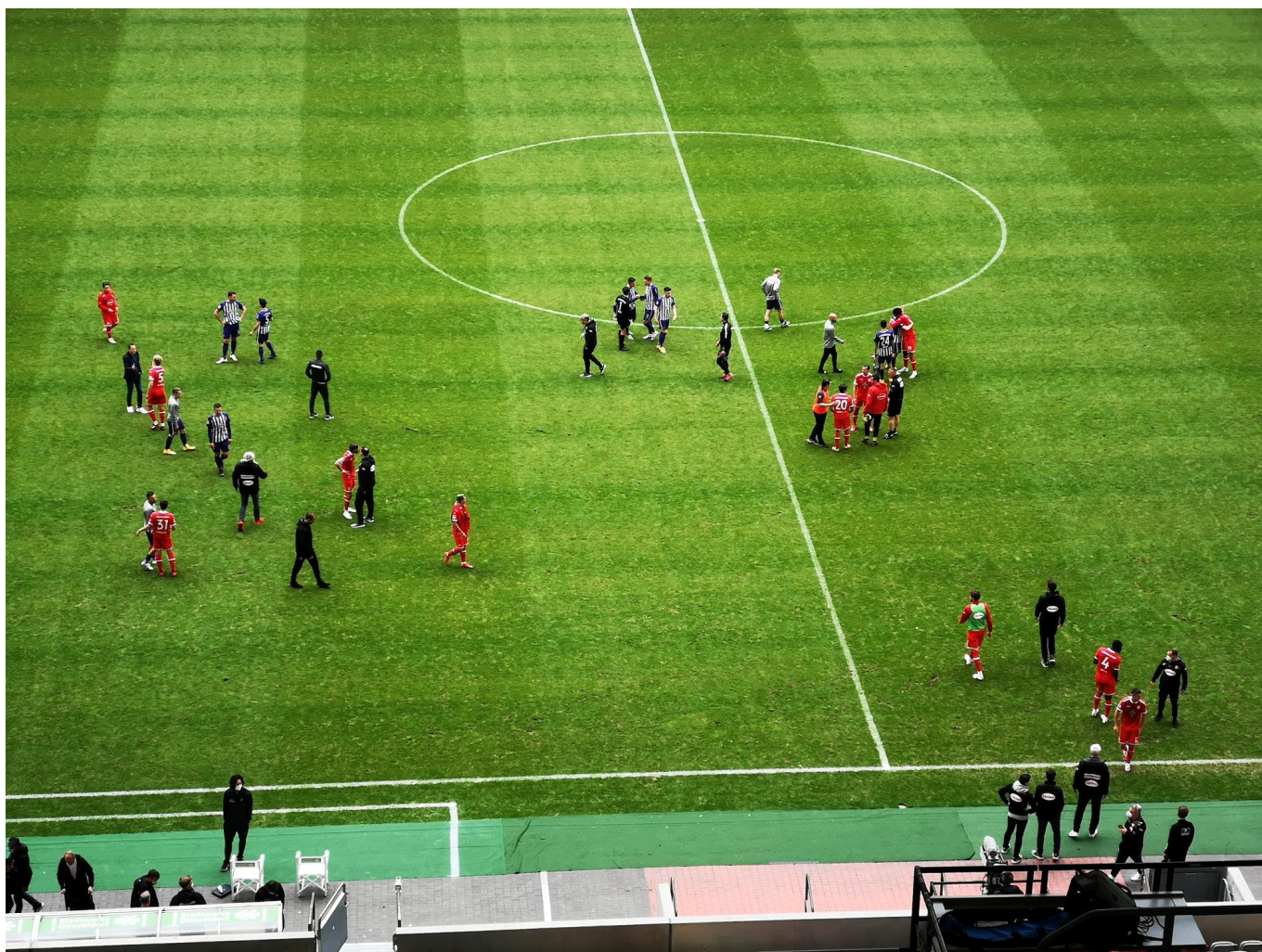
F95 vs Aue: Endlich Feierabend