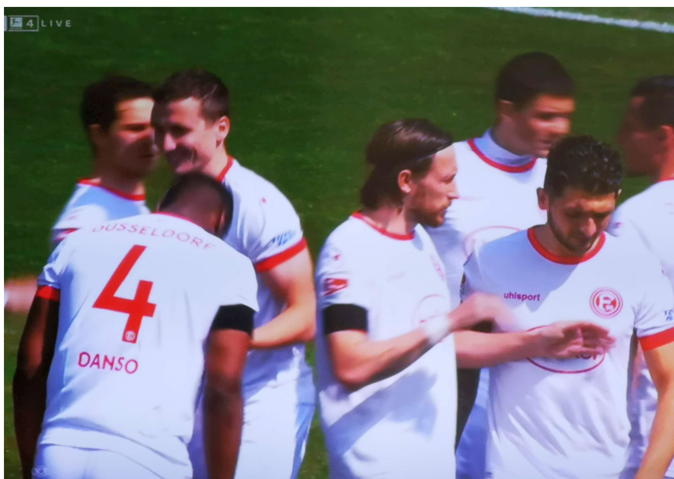
Osnabrück vs F95: Fröhliches Vorgespräch auf dem Rasen