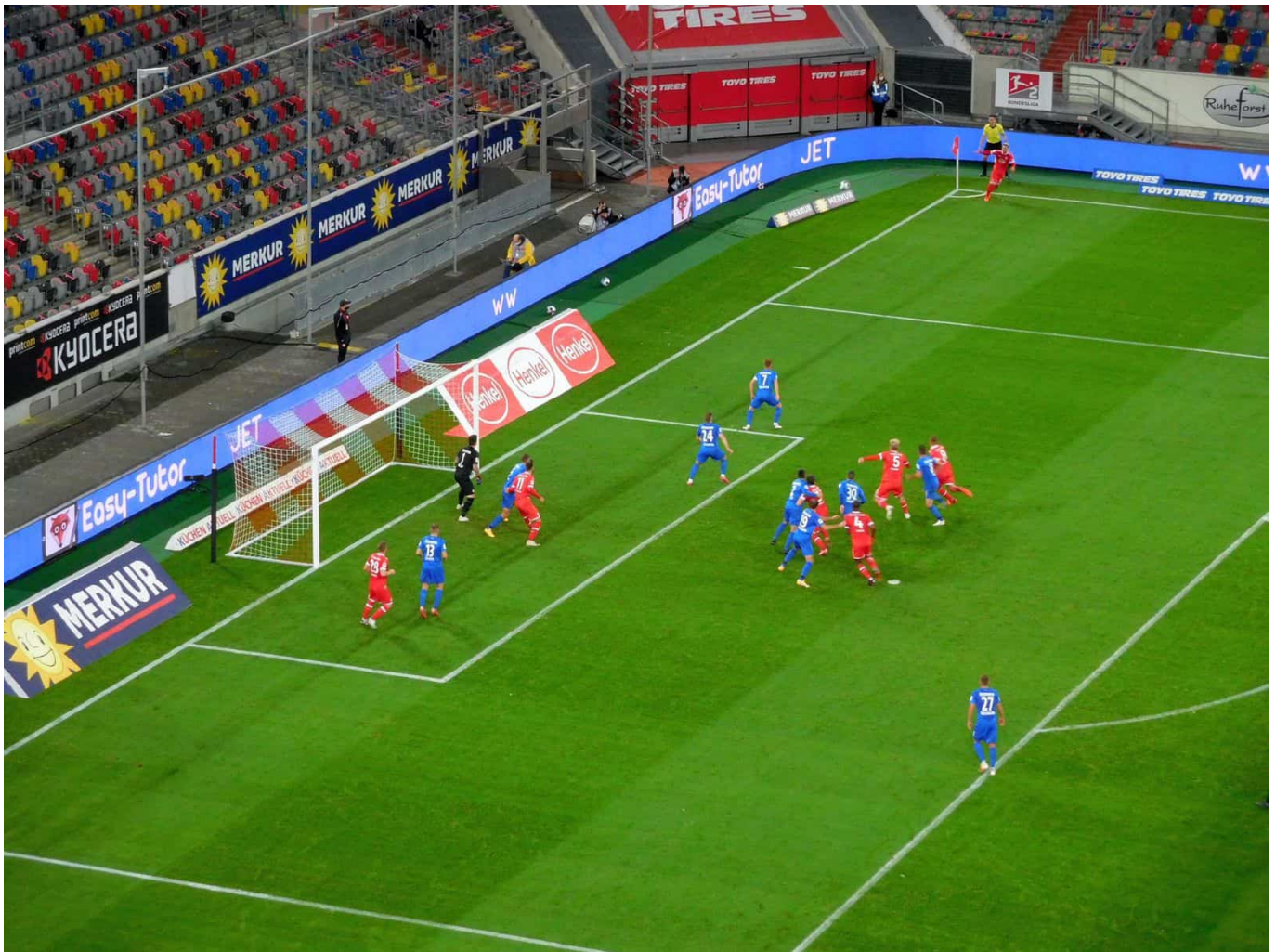
F95 vs HDH: Ecke ... Tor

Überhaupt war das ganze Angriffsspiel etwas merkwürdig angelegt. So wich Hennings in der ersten Halbzeit oft nach Linksaußen aus, wo er dann auch angespielt wurde, aber meistens den Ball verlor oder fehlpasste. Bei den immer noch viel zu wenigen Versuchen, ihn in der Mitte direkt vorm gegnerischen Keeper zu finden, stand er wie geplant, war aber dann in der Regel von Blauen umringt. Nein, spielerisch war das keine Sahnetorte, was die Jungs uns auf den Tisch stellten. Überdeutlich wurde, dass sie einfach untereinander die typischen Laufwege nicht kennen – wie auch, wo sie doch nie oder selten zusammen im Wettkampf auf der Wiese standen. [Spielbericht vom 31.10.2020]