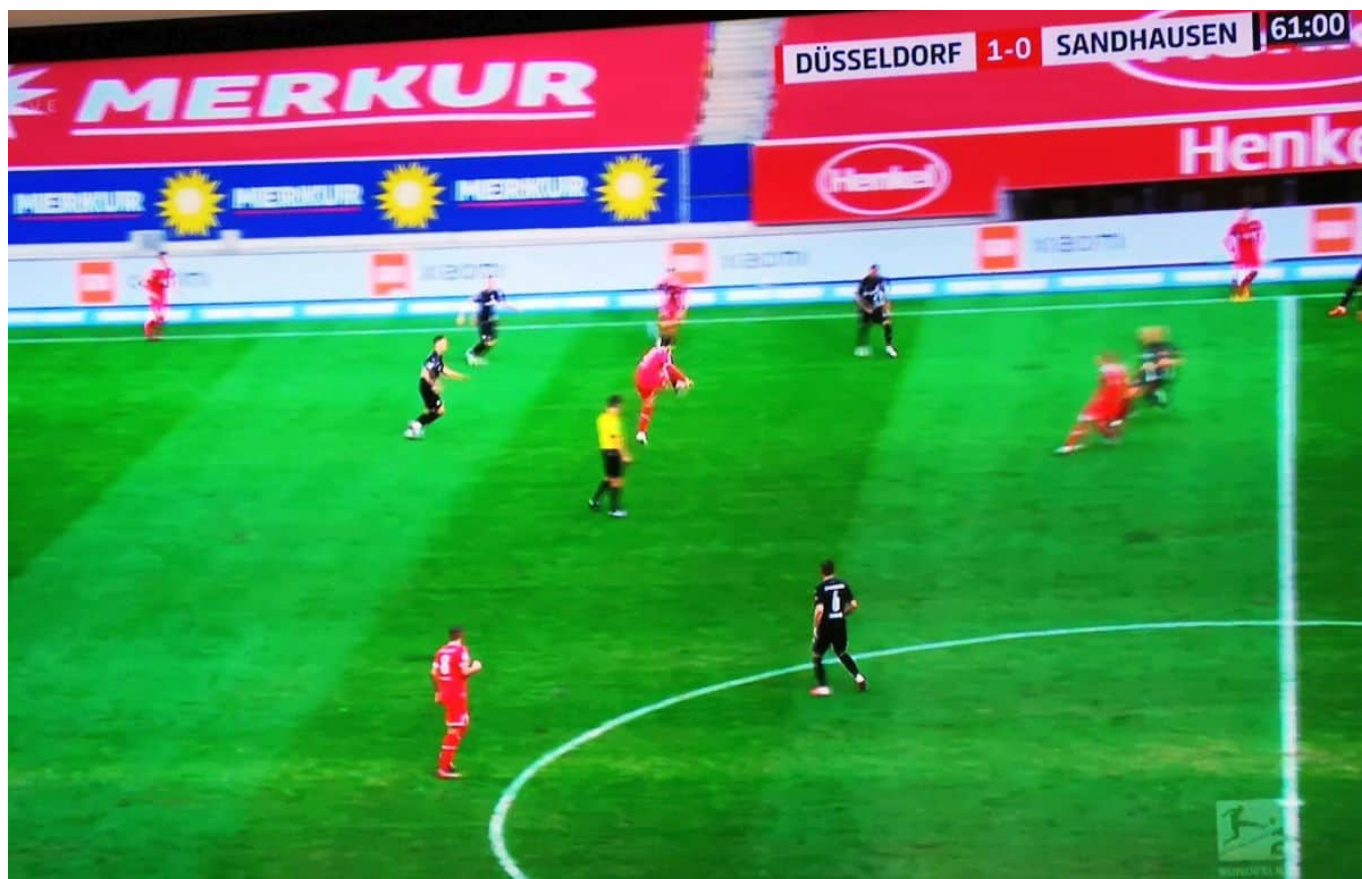
F95 vs Sandhausen: So eine Art Angriff (Screenshot)

zweite Spitze (oder so was Ähnliches) neben den ewigen Hennings zu stellen. Die Unterirdischkeit der Leistung war übrigens kein Ergebnis gebräuchter Tage aus der Verlosung, sondern systemisch.