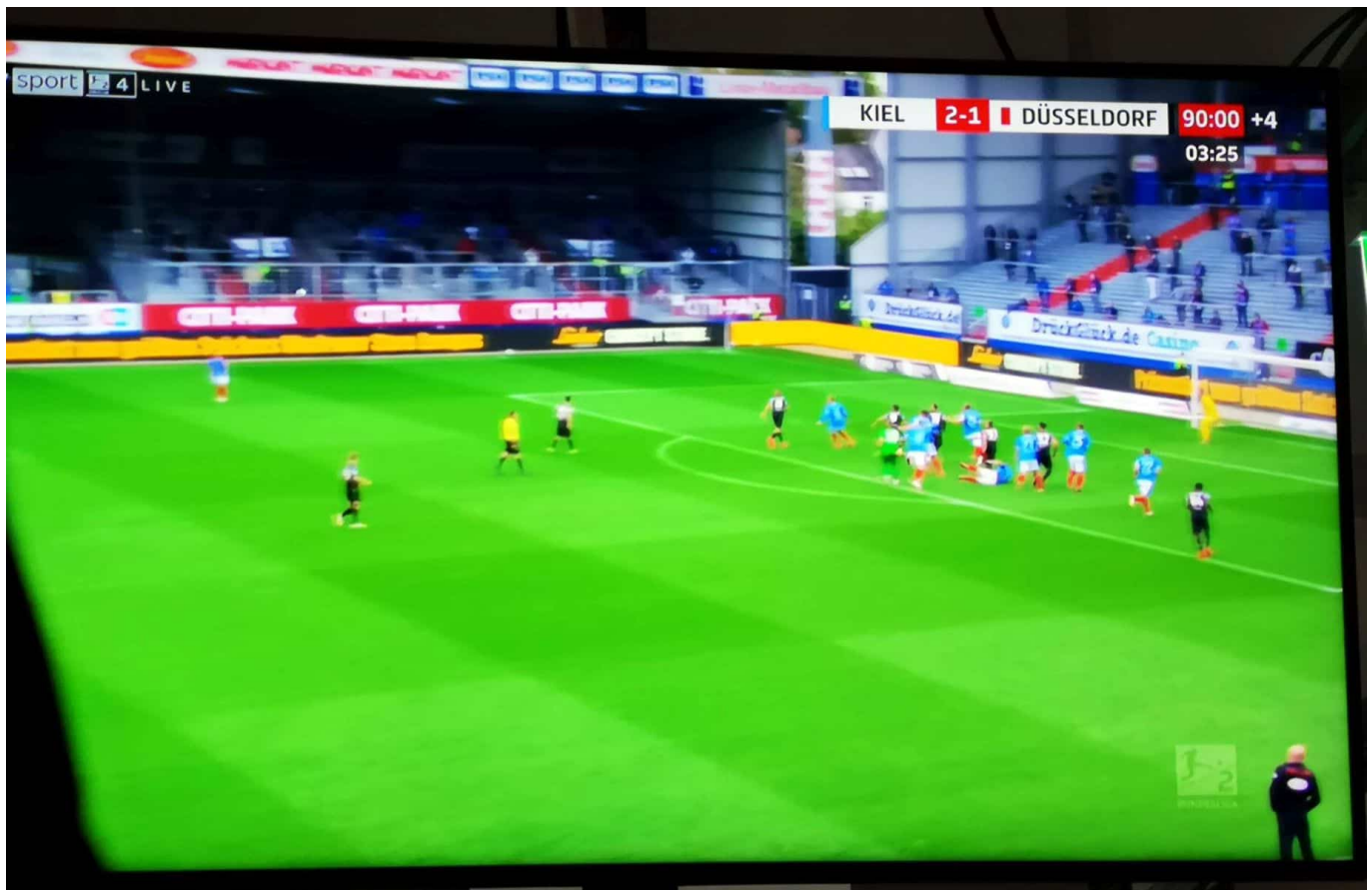
Kiel vs F95: Kurz vor Schluss

Schon an diesem Tag wurde deutlich, dass die Fortuna in der Saison ganz schön viel Scheiß am Bein haben würde. Natürlich sind diese Spekulationsspiele darüber, wo F95 ohne Fehlentscheidungen gelandet wäre, sinnlos. Aber wenn dieser Mist mit Verletzungspech zusammenkommt, wird es eben sehr, sehr schwer.