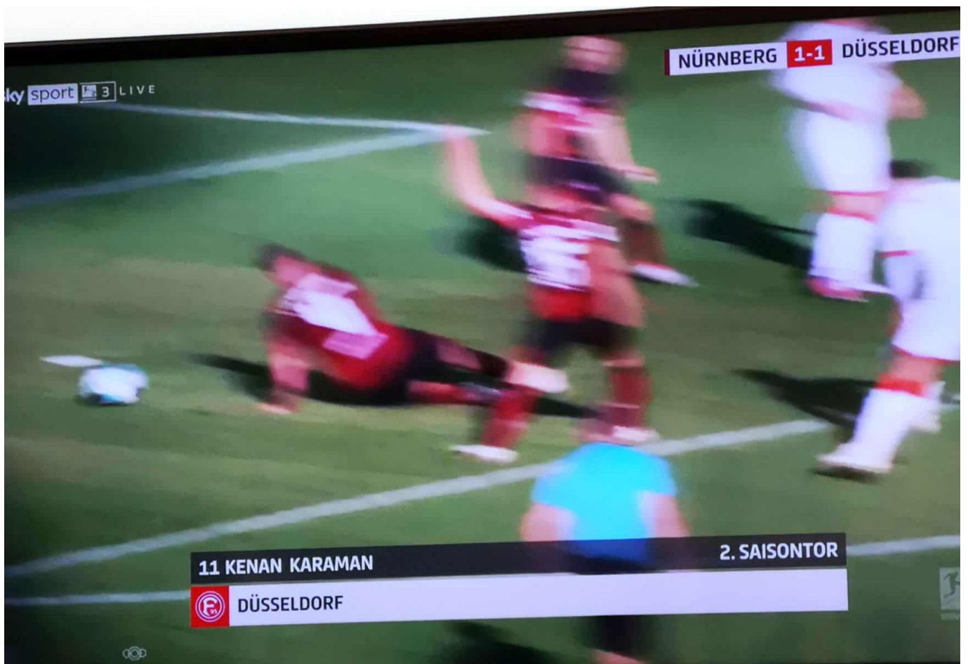
Fallende Nürnberger beim 1:1 durch Karaman