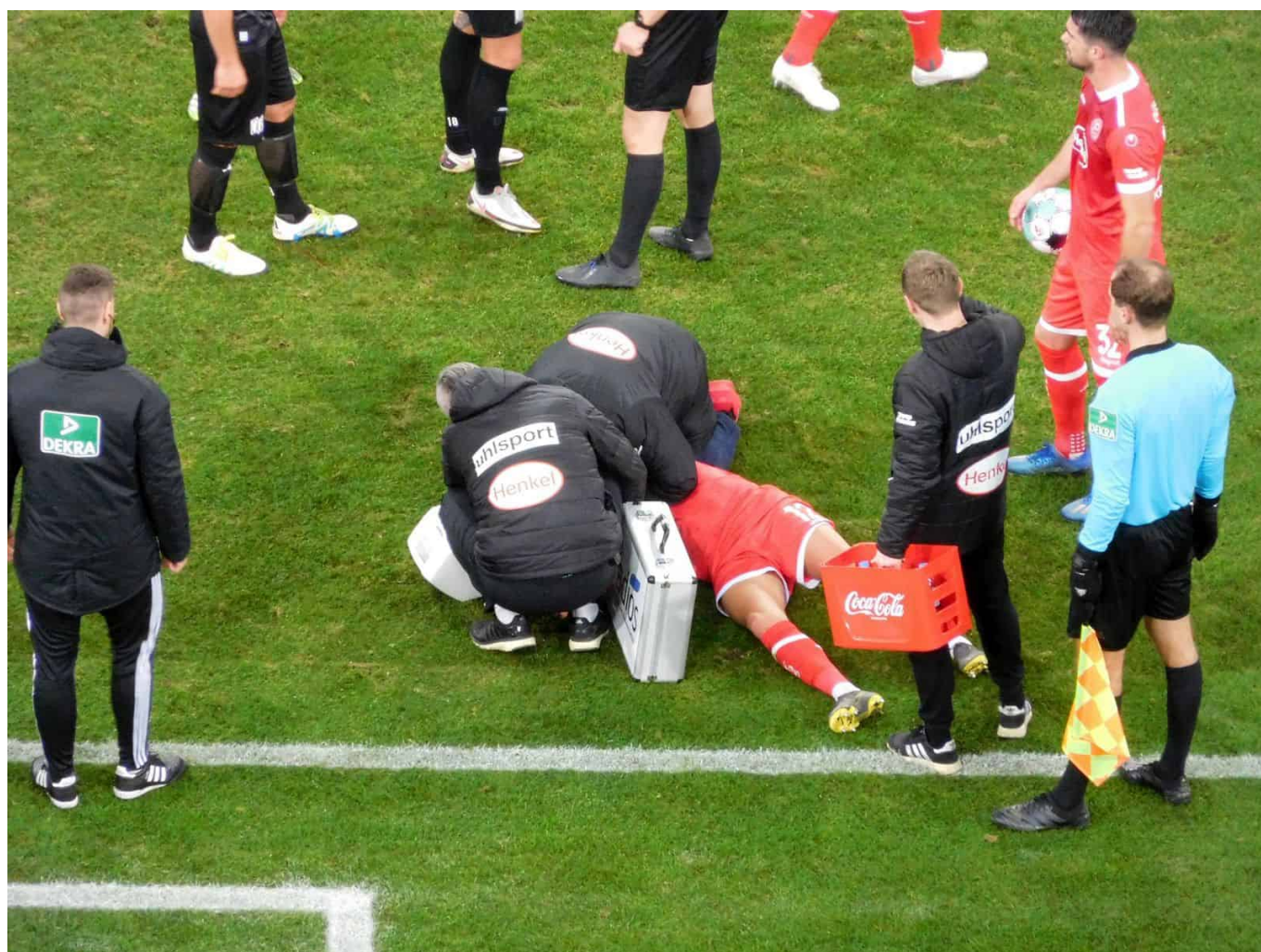
F95 vs Osnabrück: Da hätte es Rot gegen den VfLer geben müssen.