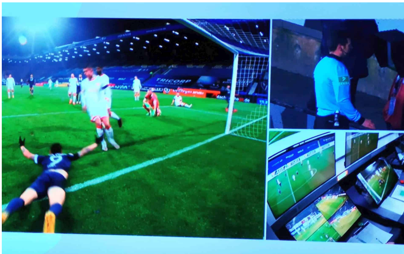
Bochum vs F95: Der Videobeweis, der im Hinspiel zum Elfmeter führte

Torschuss! Ergebnis bekannt. Hätte er nachgedacht, hätte er es auf die mögliche Vollstreckung ankommen lassen. Das wäre dann auch das 1:0 gewesen, aber die Weißen hätten weiter zu elft kicken dürfen. [Spielbericht vom 01.12.2020]