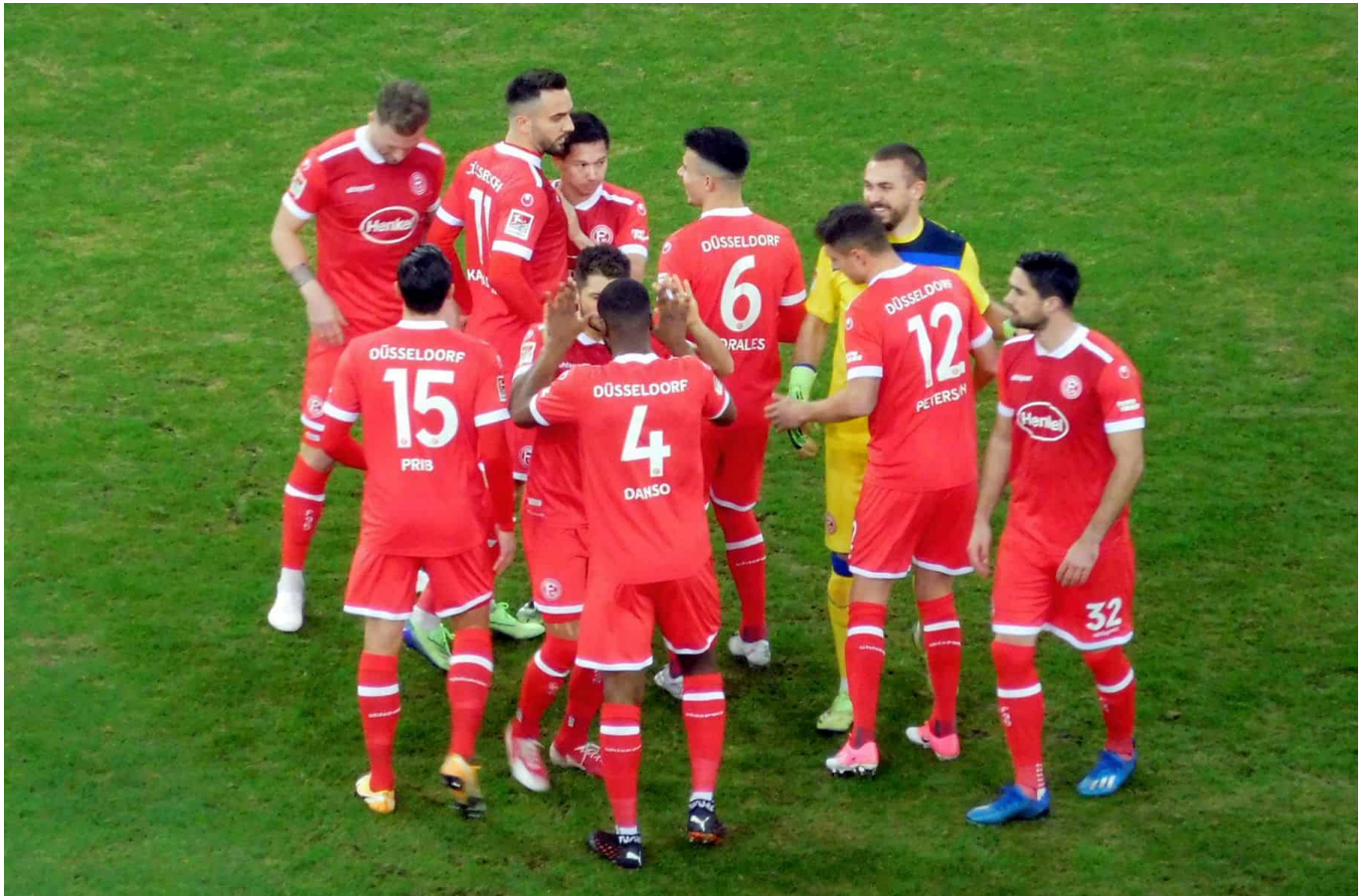
F95 vs Paderborn: Die Stimmung stimmt im Rudel

Okay, man brachte den Sieg mit Ach und Krach nachhause, was sich die Truppe aber in der zweiten Halbzeit an Schlampigkeit leistete, hätte in der normalen Arbeitswelt zu einer Reihe von Abmahnungen geführt. Daran ändert auch nichts, dass F95 nach dem fünften Sieg in Folge und einem 5. Tabellenplatz im Gleichschritt mit Bochum das Aufstiegsgespenst droht.