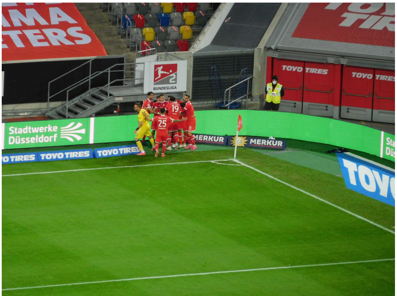
F95 vs KSC: Der letzte Jubel an Tagen wie diesem