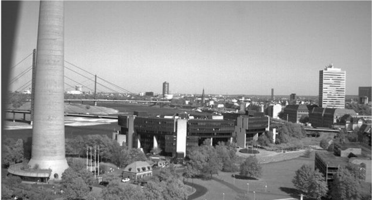
Auch am Landtag gibt's Webcam - allerdings ohne Live-Bilder (Screenshot)

Drei Blickwinkel, die vom Landtag NRW angeboten werden Die Legende besagt, dass man die Webcam 1 am Landtag NRW einfach vergessen hat. Und trotzdem sendet sie das Schwarzweißbild eines Blicks vom Stadttor aufs Gebäude. Tatsächlich sind s/w-Webcams, die man manuell aktualisieren muss, irgendwie schon sehr 2005. Das gilt auch für den zweiten Blickwinkel, bei dem über die Kniebrückenrampe auf den Landtag schaut. Die dritte Kamera hängt im Plenarsaal und sendet nur, wenn dort gerade eine Session stattfindet.