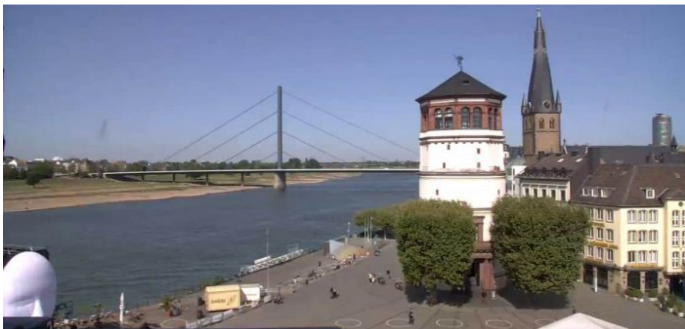
Diese städtische Webcam zeigt das Treiben auf dem Burgplatz (Screenshot)

Dir gefällt, was The Düsseldorfer über die schönste Stadt am Rhein schreibt? Und vielleicht auch die Artikel zu anderen Themen? Du möchtest unsere Arbeit unterstützen? Nichts leichter als das! Unterstütze uns durch ein Abschließen eines Abos oder durch den Kauf einer Lesebeteiligung - und zeige damit, dass The Düsseldorfer dir etwas wert ist.