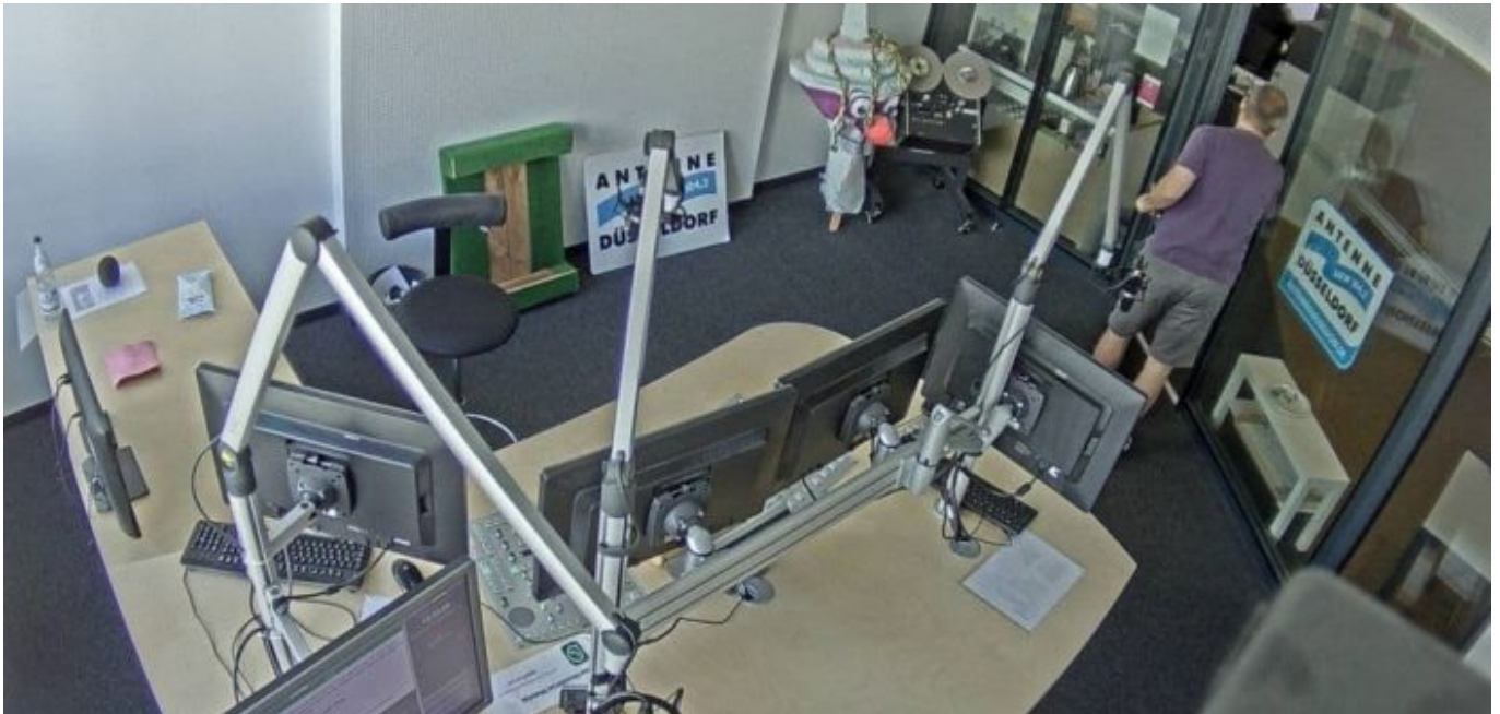
Antenne Düsseldorf: Zwei Blicke ins Sendestudio (Screenshot)

den Rhein sind einfach schön und wären noch schöner, wenn man den Dampf leibhaftig aufsteigen sehen könnte.