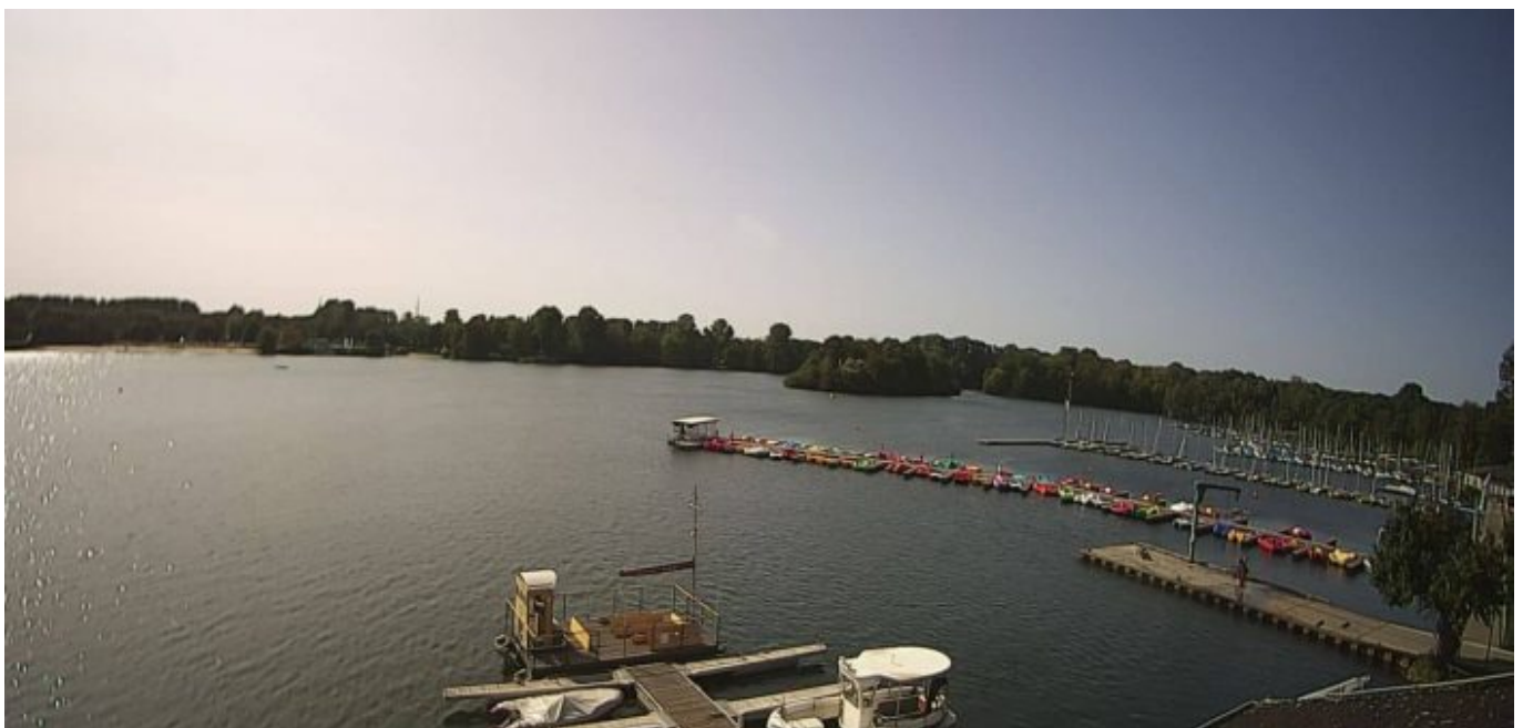
Webcam am Nordufer des Unterbacher Sees mit Blick Richtung Südwesten (Screenshot)

Trotzdem sind diese Webcam-Blicke aus großer Höhe eine prima Möglichkeit, sich über das Wetter im Norden der Stadt zu informieren.