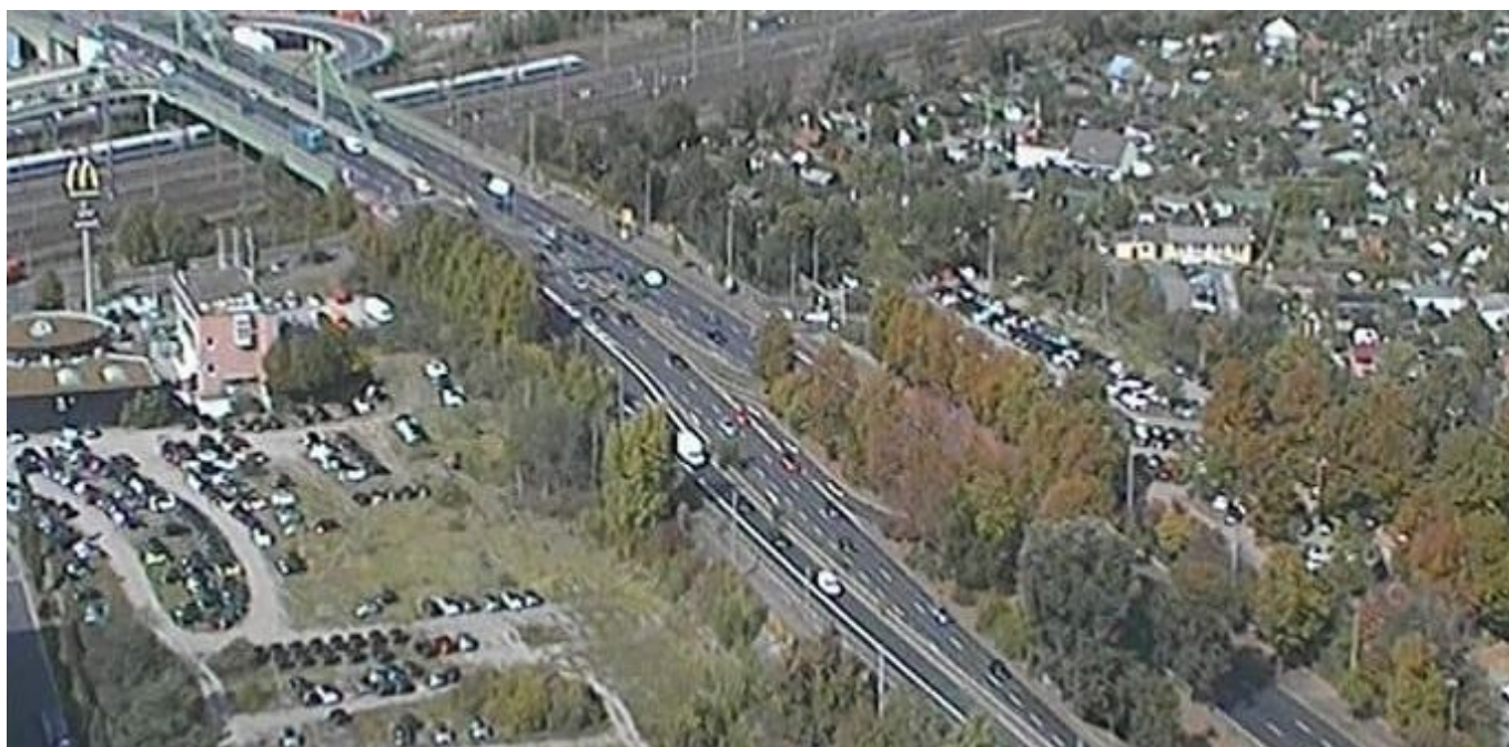
Die vermutlich am höchsten angebrachte Webcam auf dem Dach des ARAG-Hochhauses (Screenshot)

ARAG-Hochhaus: 5 Blicke aus 125 Metern Höhe