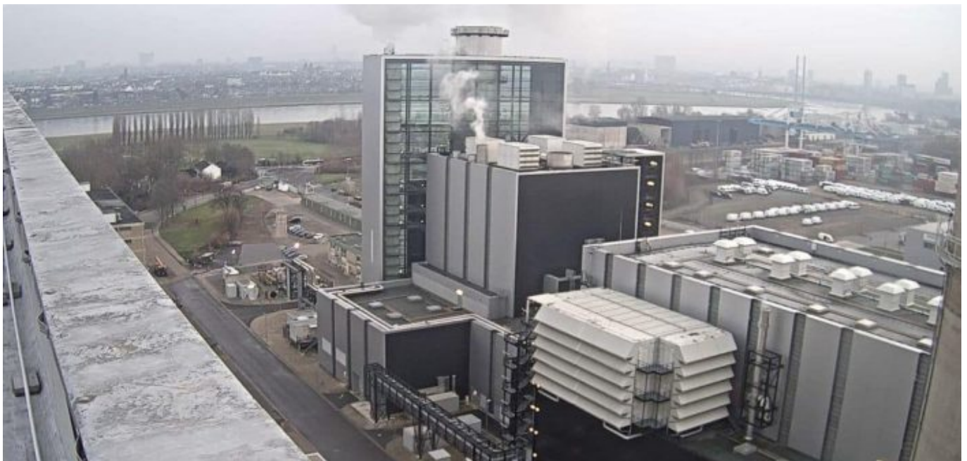
Blick auf den Block Fortuna des Kraftwerks auf der Lausward (Screenshot)

vermutlich ist die alte Webcam kaputt, denn ein Bild von ihr wird nicht angeboten. Auch hier wird nicht live gestreamt. Gerade morgens und abends zeigt die verbliebene Kamera manchmal wunderschöne Bilder, einen echten Nährwert konnten wir nicht erkennen.