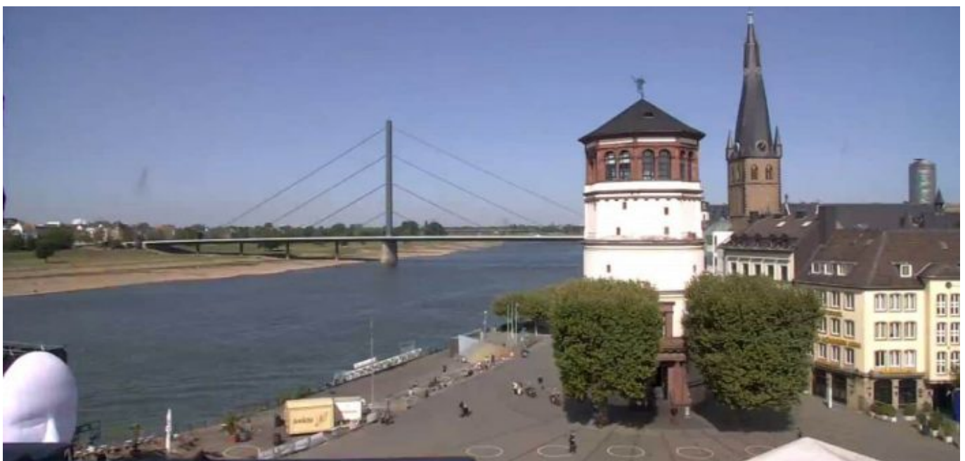
Diese städtische Webcam zeigt das Treiben auf dem Burgplatz (Screenshot)

Dir gefällt, was The Düsseldorfer über die schönste Stadt am Rhein schreibt? Und vielleicht auch die Artikel zu anderen Themen? Du möchtest unsere Arbeit unterstützen? Nichts leichter als das! Unterstütze uns durch ein Abschließen eines Abos oder durch den Kauf einer Lesebeteiligung - und zeige damit, dass The Düsseldorfer dir etwas wert ist.