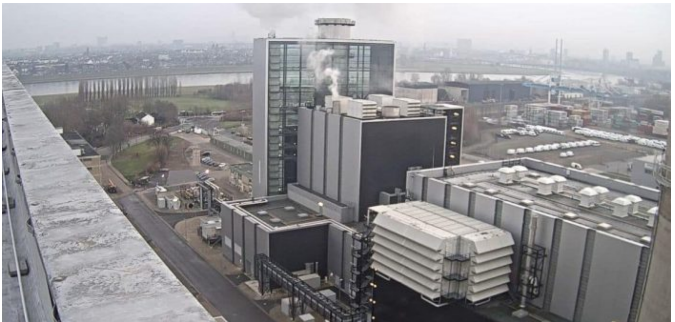
Blick auf den Block Fortuna des Kraftwerks auf der Lausward (Screenshot)

vermutlich ist die alte Webcam kaputt, denn ein Bild von ihr wird nicht angeboten. Auch hier wird nicht live gestreamt. Gerade morgens und abends zeigt die verbliebene Kamera manchmal wunderschöne Bilder, einen echten Nährwert konnten wir nicht erkennen.