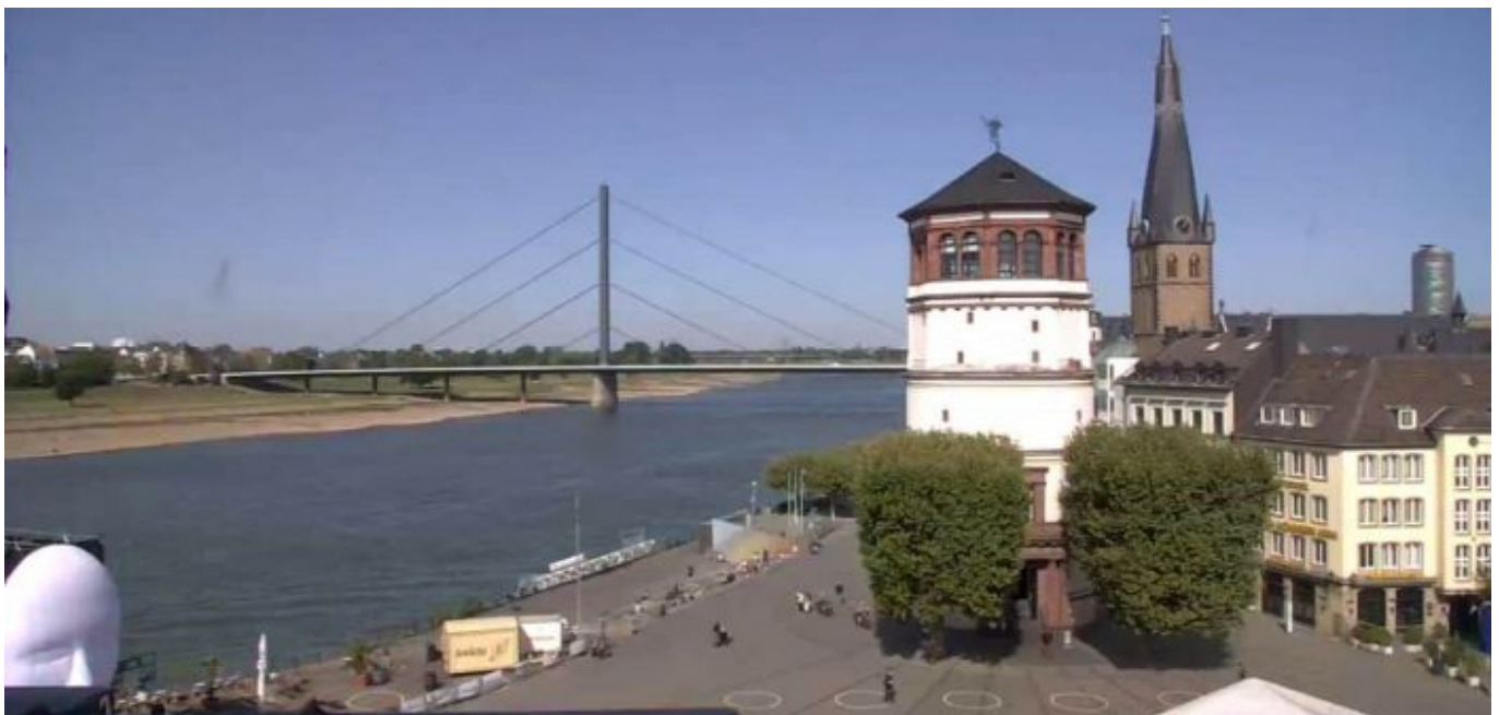
Diese städtische Webcam zeigt das Treiben auf dem Burgplatz (Screenshot)

Dir gefällt, was The Düsseldorfer über die schönste Stadt am Rhein schreibt? Und vielleicht auch die Artikel zu anderen Themen? Du möchtest unsere Arbeit unterstützen? Nichts leichter als das! Unterstütze uns durch ein Abschließen eines Abos oder durch den Kauf einer Lesebeteiligung - und zeige damit, dass The Düsseldorfer dir etwas wert ist.