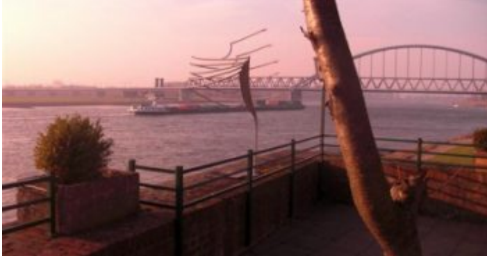
KCD Essen & Trinken – in Hamm direkt am Rhein

Man fragt sich, weshalb dieser herrliche Ort am Rhein noch unter „Geheimtipp“ läuft, denn KCD Essen & Trinken steht anderen Biergärten am Rhein in nichts nach. Mag sein, dass viele Menschen, die sich in Kappeshamm nicht so auskennen, das Restaurant für das „Vereinsheim“ des Kanu Club Düsseldorf halten. Mag sein, dass die Terrasse über dem Fluttor einfach oft übersehen wird. Jedenfalls kann man hier von Mittwoch bis Sonntag einen Sonnenuntergang genießen wie er schöner über dem linken Rheinufer kaum sein kann. Im Biergarten haben immerhin 250 Leute Platz, die dann sehr gutbürgerliche Speisen von der Sommerkarte bestellen und dazu kühle Getränke nehmen können.