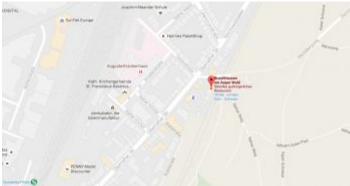
Map: Buschhausen am Aaper Wald

Diese eigentümliche Gastwirtschaft liegt enorm verkehrsgünstig, denn hinter dem Zaun vom Biergarten findet sich der Bahnsteig der U2 (früher 712). Man ist mit der U-Bahn also von fast überall in der Stadt in kurzer Zeit da, lässt sich aus der Bahn gleich auf einen Stuhl fallen, um dann gutbürgerliches Essen auf gutem Niveau und leckere Getränke zu genießen. Man kann dem Konglomerat aus Gebäuden gut ablesen, dass es sich beim Buschhausen um eine Traditionswirtschaft handelt, die organisch gewachsen ist. Der Biergarten findet sich zwischen dem Haupthaus und der Bahnlinie und ist an schönen Tagen am Wochenende oft prall gefüllt. Unter der Woche trifft man hier aber vor allem die Stammgäste aus den angrenzenden Vierteln – vor allem aus Rath und Oberrath – sowie Wanderer und Spaziergänger, die den Aaper Wald durchstreift haben. Auch Radfahrer kehren nach Bergauf-Bergab-Touren gern hier ein.