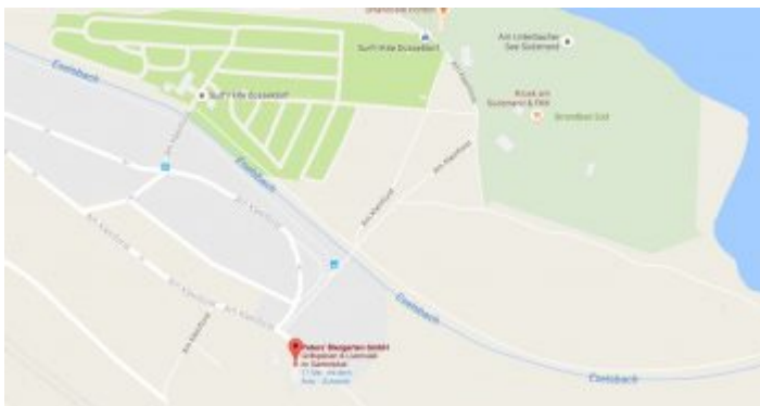
Map: Peters Biergarten am Unterbacher See

Beinahe versteckt liegt dieser extrem typische Biergarten unweit des Südstrands am Unterbacher See; wenn man vom Parkplatz oder der Haltestelle der Buslinie 891 in Richtung Elbsee spaziert, kommt man nach wenigen Metern dorthin. Und sieht sofort, dass dieser wunderschöne Biergarten aus einer Imbissbude entstanden sein muss. So liegt das Schwergewicht der Speisen auch bei den entsprechenden Themen. Aber erstens findet sich hier eine der leckersten Currywürste dieser Stadt, und zweitens gibt's Füschen Alt vom Fass. Beliebt ist Peters Biergarten auch für geschlossenen Gesellschaften, weil man sich dann auch besondere Gerichte wünschen kann.