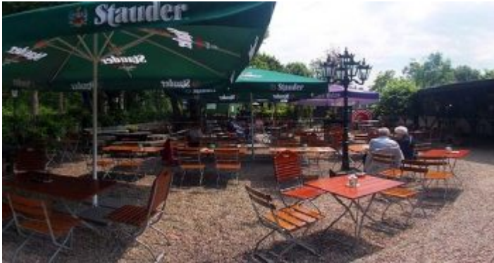
Peters Biergarten am Unterbacher See

Beinahe versteckt liegt dieser extrem typische Biergarten unweit des Südstrands am Unterbacher See; wenn man vom Parkplatz oder der Haltestelle der Buslinie 891 in Richtung Elbsee spaziert, kommt man nach wenigen Metern dorthin. Und sieht sofort, dass dieser wunderschöne Biergarten aus einer Imbissbude entstanden sein muss. So liegt das Schwergewicht der Speisen auch bei den entsprechenden Themen. Aber erstens findet sich hier eine der leckersten Currywürste dieser Stadt, und zweitens gibt's Füschen Alt vom Fass. Beliebt ist Peters Biergarten auch für geschlossenen Gesellschaften, weil man sich dann auch besondere Gerichte wünschen kann.