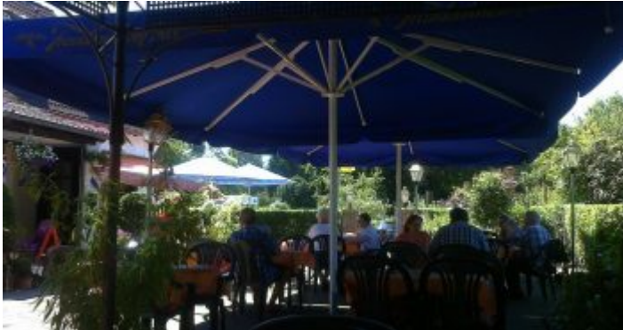
Biergarten im KGV Stoffeln im Südpark

Im Südpark samt Volksgarten gibt es insgesamt drei Biergärten sowie ein richtig feines Restaurant und das Café am Kinderbauernhof. Am wenigsten bekannt ist aber der absolut urige Biergarten im Kleingartenverein Stoffeln. Der liegt an der Gabelung von Stoffeler Kapellenweg und In den Großen Benden, ist also prima mit dem Auto (von der Werstener/Moorenstraße aus) und mit dem ÖPNV (Haltestelle Uni Nord/Christophstraße) zu erreichen. Typischer kann die Gastronomie einer Schrebergartenkolonie kaum sein. Man sitzt in dicht mit Pflanzen aller Art umschlossenen Hof unter großen Schirmen; in der Voliere zwitschern Vögel, und an den Tischen sitzen vor allem Vereinsmitglieder und ihre Freunde. Schon seit vielen Jahren wird hier balkanesisch gekocht, wobei natürlich auch die üblichen Schnitzel und andere gutbürgerliche Speisen gereicht werden. Der Service ist enorm freundlich und immer zu einem Schwätzchen aufgelegt, wenn es nicht gar so voll ist. Viele Stammgäste kommen mindestens einmal die Woche zum Abendessen – außer dienstags, da hat der Biergarten geschlossen.