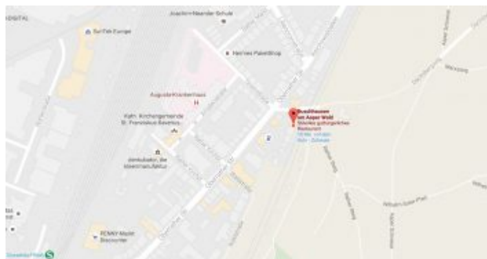
Map: Buschhausen am Aaper Wald

Diese eigentümliche Gastwirtschaft liegt enorm verkehrsgünstig, denn hinter dem Zaun vom Biergarten findet sich der Bahnsteig der U2 (früher 712). Man ist mit der U-Bahn also von fast überall in der Stadt in kurzer Zeit da, lässt sich aus der Bahn gleich auf einen Stuhl fallen, um dann gutbürgerliches Essen auf gutem Niveau und leckere Getränke zu genießen. Man kann dem Konglomerat aus Gebäuden gut ablesen, dass es sich beim Buschhausen um eine Traditionswirtschaft handelt, die organisch gewachsen ist. Der Biergarten findet sich zwischen dem Haupthaus und der Bahnlinie und ist an schönen Tagen am Wochenende oft prall gefüllt. Unter der Woche trifft man hier aber vor allem die Stammgäste aus den angrenzenden Vierteln – vor allem aus Rath und Oberrath – sowie Wanderer und Spaziergänger, die den Aaper Wald durchstreift haben. Auch Radfahrer kehren nach Bergauf-Bergab-Touren gern hier ein.