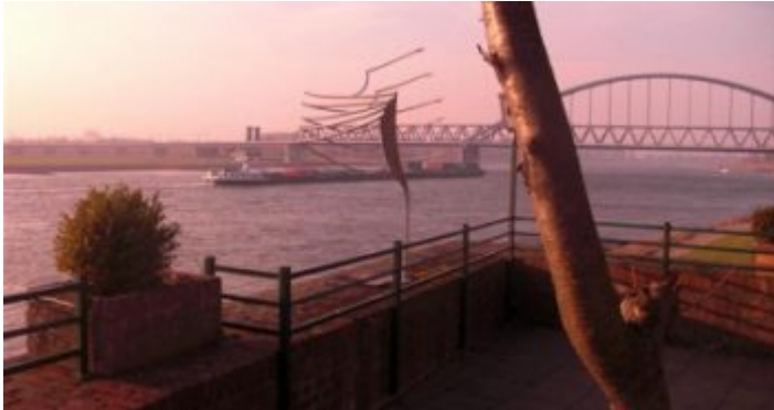
KCD Essen & Trinken – in Hamm direkt am Rhein

Man fragt sich, weshalb dieser herrliche Ort am Rhein noch unter „Geheimtipp“ läuft, denn KCD Essen & Trinken steht anderen Biergärten am Rhein in nichts nach. Mag sein, dass viele Menschen, die sich in Kappeshamm nicht so auskennen, das Restaurant für das „Vereinsheim“ des Kanu Club Düsseldorf halten. Mag sein, dass die Terrasse über dem Fluttor einfach oft übersehen wird. Jedenfalls kann man hier von Mittwoch bis Sonntag einen Sonnenuntergang genießen wie er schöner über dem linken Rheinufer kaum sein kann. Im Biergarten haben immerhin 250 Leute Platz, die dann sehr gutbürgerliche Speisen von der Sommerkarte bestellen und dazu kühle Getränke nehmen können.