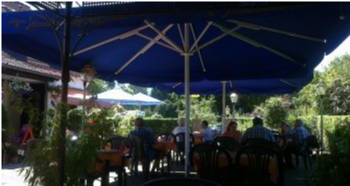
Biergarten im KGV Stoffeln im Südpark

Im Südpark samt Volksgarten gibt es insgesamt drei Biergärten sowie ein richtig feines Restaurant und das Café am Kinderbauernhof. Am wenigsten bekannt ist aber der absolut urige Biergarten im Kleingartenverein Stoffeln. Der liegt an der Gabelung von Stoffeler Kapellenweg und In den Großen Benden, ist also prima mit dem Auto (von der Werstener/Moorenstraße aus) und mit dem ÖPNV (Haltestelle Uni Nord/Christophstraße) zu erreichen. Typischer kann die Gastronomie einer Schrebergartenkolonie kaum sein. Man sitzt in dicht mit Pflanzen aller Art umschlossenen Hof unter großen Schirmen; in der Voliere zwitschern Vögel, und an den Tischen sitzen vor allem Vereinsmitglieder und ihre Freunde. Schon seit vielen Jahren wird hier balkanesisch gekocht, wobei natürlich auch die üblichen Schnitzel und andere gutbürgerliche Speisen gereicht werden. Der Service ist enorm freundlich und immer zu einem Schwätzchen aufgelegt, wenn es nicht gar so voll ist. Viele Stammgäste kommen mindestens einmal die Woche zum Abendessen – außer dienstags, da hat der Biergarten geschlossen.