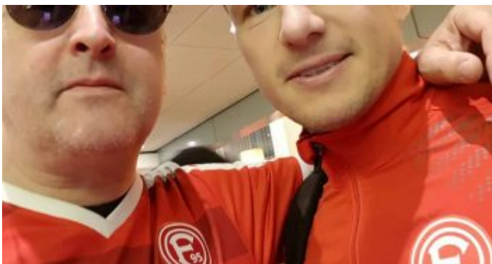
Ötte in seiner Rolle als Fortuna-Fan – hier mit Käpt'n