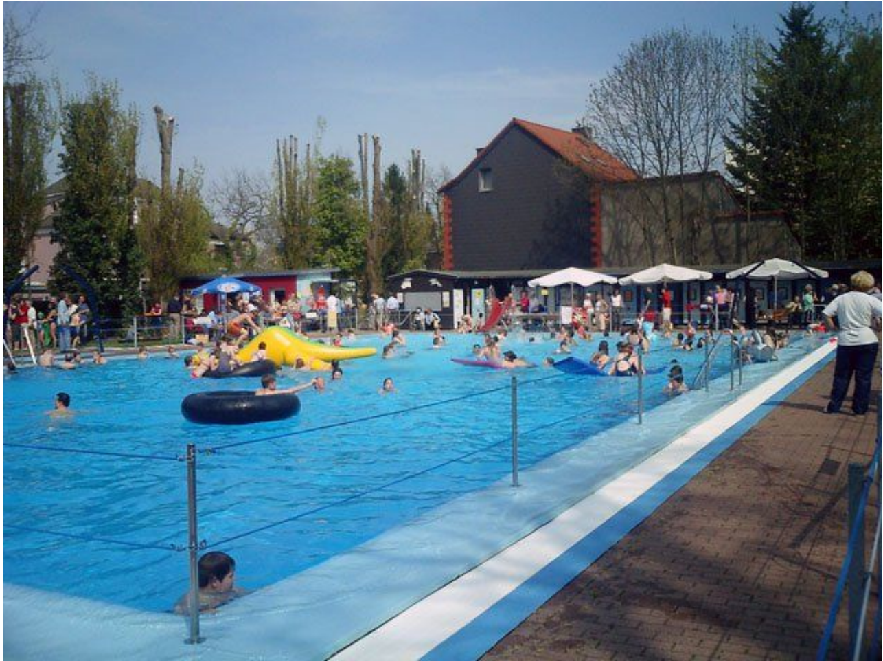
Düsseldorf's kleinstes Freibad: „Flossen Weg“ in Kaiserswerth

Öffnungszeiten: Montag, Mittwoch und Freitag von 07:00 bis 20:00 Uhr ; Dienstag, Donnerstag, Samstag und Sonntag