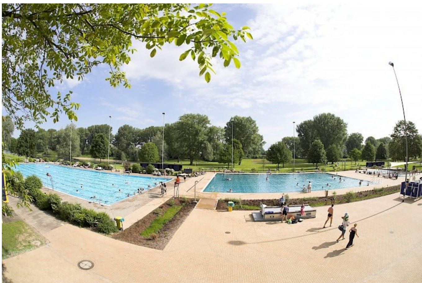
Strandbad Lörick

Schwimmen und Baden dort gesundheitsgefährlich wurde, beschränkte man in den Sechzigerjahren den Badebetrieb auf das moderne Freibad. Ältere Düsseldorfer:innen werden sich erinnern: Nicht selten pilgerten damals Dutzende Altstadtbesucher:innen mitten in der Nacht nach Lörick, um den Zaun illegal zu überwinden und im See zu baden – vorwiegend nackt, natürlich. Das gibt es heute nicht mehr, dafür wurde das Strandbad aber vor Kurzem einer gründlichen Renovierung unterzogen.