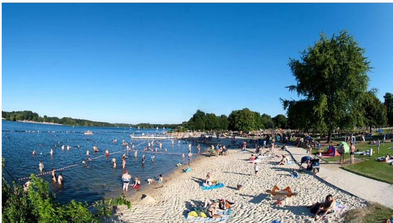
Unterbacher See – Südstrand

Öffnungszeiten: täglich von 10:00 bis 19:30 Uhr, letzter Einlass 18:30 Uhr, Badeschluss 19:00 Uhr