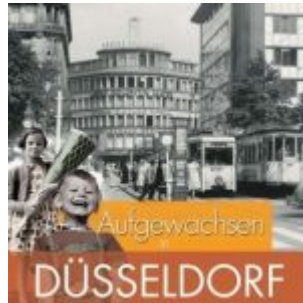
Wulf Metzmacher: Aufgewachsen in Düsseldorf...