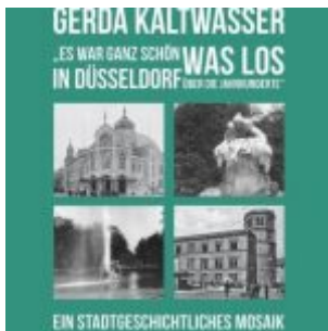
Gerda Kaltwasser: Es war ganz schön was los in Düsseldorf...