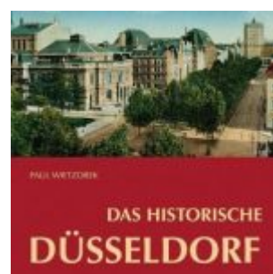
Paul Wietzorek: Das historische Düsseldorf