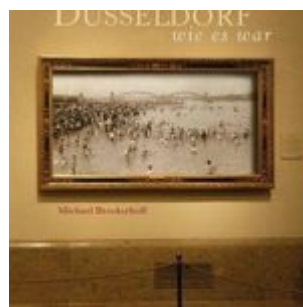
Michael Brockerhoff: Düsseldorf wie es war