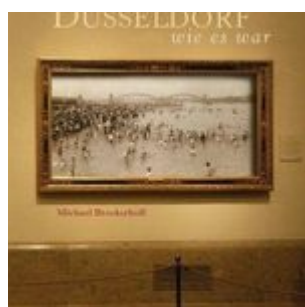
Michael Brockerhoff: Düsseldorf wie es war