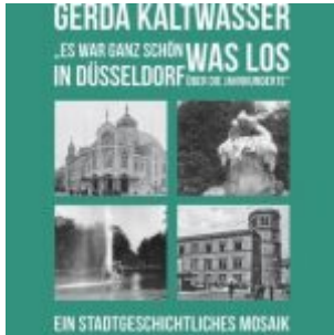
Gerda Kaltwasser: Es war ganz schön was los in Düsseldorf...