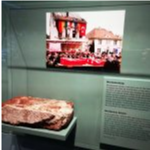
Unser Land: Der Mordanschlag von Solingen