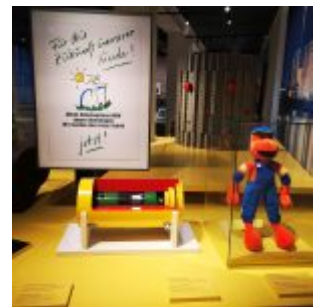
Unser Land: Volksbegehren gegen Atomkraft