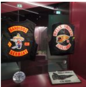
Unser Land: Rockerbanden