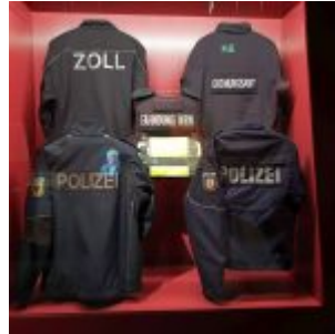
Unser Land: Sicherheitskräfte