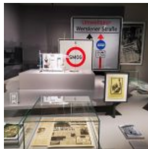
Unser Land: Luftverschmutzung durch Industrie und Autos