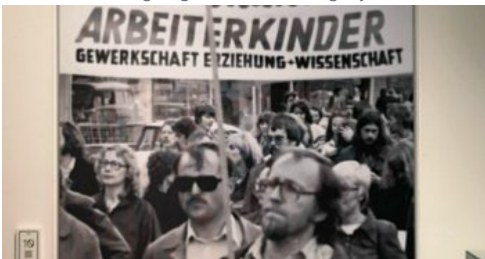
Unser Land: Lehrer fordern Chancengleichheit... vergebens

Aber, ja, das beschreibt halt die historische Realität, die mit dem Zusammenschustern eines Bundeslandes aus zwei Provinzen, die nichts gemein haben, durch die Briten beginnt und mit der Schufferei des Wirtschaftswunders weitergeht, um in den Siebzigern trotz Krisen in diverse progressive und emanzipatorische Bewegungen mündet ... von deren Bemühungen kaum etwas übriggeblieben ist. Bis auf ein Titelbild des Spiegels mit Joseph Beuys drauf sowie einer Beuys-Zeichnung kommen Kunst und Kultur nicht vor, Mode fehlt völlig, und die positiven Highlights der letzten 75 Jahre erscheinen, wenn überhaupt, dann nur am Rande, zum Beispiel der Besuch der Queen 1965 in Düsseldorf oder die fröhlichen Feiardemos der Friedensbewegung in den Achtzigerjahren.