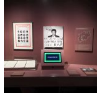
Unser Land: Die Schleyerentführung