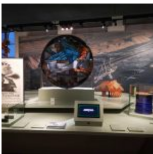
Unser Land: Braunkohletagebau gegen jeden Widerstand