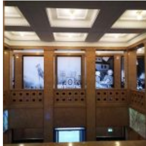
Unser Land: Treppenhaus im Behrensbau