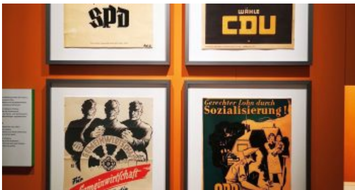
Unser Land: CDU und SPD damals mit sozialistischen Positionen

du uns finanziell unterstützen. Durch ein Abo oder den Kauf einer einmaligen Lesebeteiligung Wir würden uns sehr freuen.