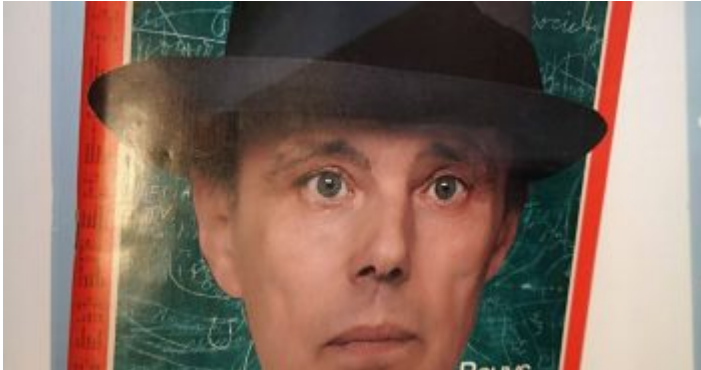
Unser Land: Ein kleines bisschen Beuys...

Aber, ja, das beschreibt halt die historische Realität, die mit dem Zusammenschustern eines Bundeslandes aus zwei Provinzen, die nichts gemein haben, durch die Briten beginnt und mit der Schufferei des Wirtschaftswunders weitergeht, um in den Siebzigern trotz Krisen in diverse progressive und emanzipatorische Bewegungen mündet ... von deren Bemühungen kaum etwas übriggeblieben ist. Bis auf ein Titelbild des Spiegels mit Joseph Beuys drauf sowie einer Beuys-Zeichnung kommen Kunst und Kultur nicht vor, Mode fehlt völlig, und die positiven Highlights der letzten 75 Jahre erscheinen, wenn überhaupt, dann nur am Rande, zum Beispiel der Besuch der Queen 1965 in Düsseldorf oder die fröhlichen Feiardemos der Friedensbewegung in den Achtzigerjahren.