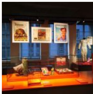
Unser Land: Bayer Leverkusen