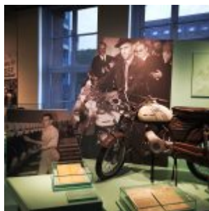
Unser Land: Die ersten Gastarbeiter