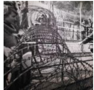
Unser Land: Zerstörte Bülcruck 1945