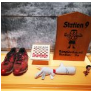
Unser Land: Die Trimm-dich-Kampagne