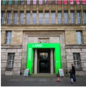
Unser Land: Eingang zum Behrensbau