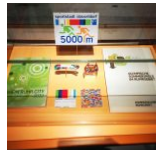
Unser Land: Sportstadt Düsseldorf