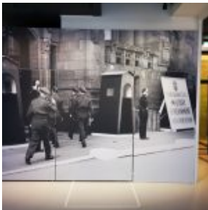
Unser Land: Die Briten beziehen den Stahlhof