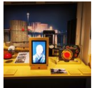
Unser Land: Widerstand gegen AKW