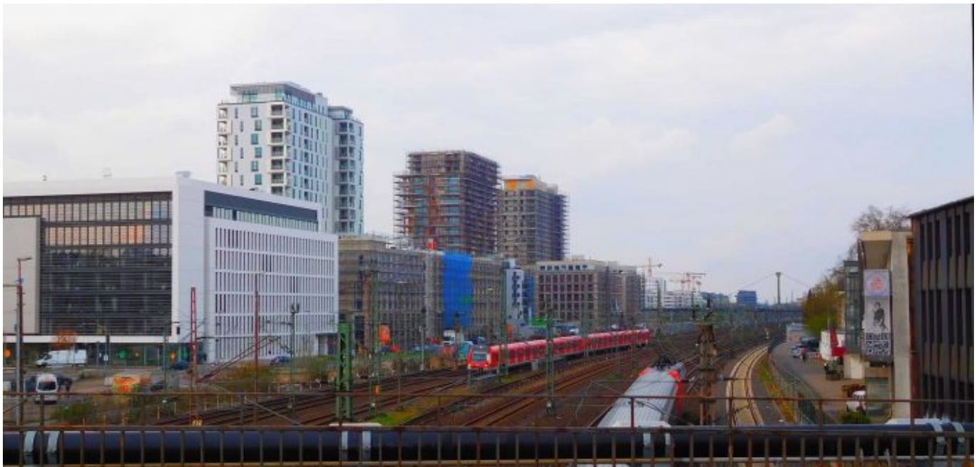
Toulouser Allee, halbfertig

Als die Linie 6 noch eine Ringlinie war, konnte man sich mit der richtigen Richtung nicht vertun, denn am gedachten Wendepunkt, dem Brehmplatz, wurden die Schilder ausgetauscht. Heute aber soll man in die 706 Richtung Hamm steigen – das man als Kenner der Düsseldorfer Geografie im Westen verortet – wenn man nordostwärts Richtung Zoo will. Das verstehe, wer will... Wie früher startet die Linie am Depot Am Steinberg in Bilk und tourt dann bis zum Hennekamp so wie früher. Hier biegt die Bahn ab und kommt am Volksgarten vorbei. Der Straßenzug, dem die 706 folgt, heißt Lastring und führt von Oberbilk bis nach Flingern und später Düsseldorf, dem Viertel, zu dem der Zoopark gehört.