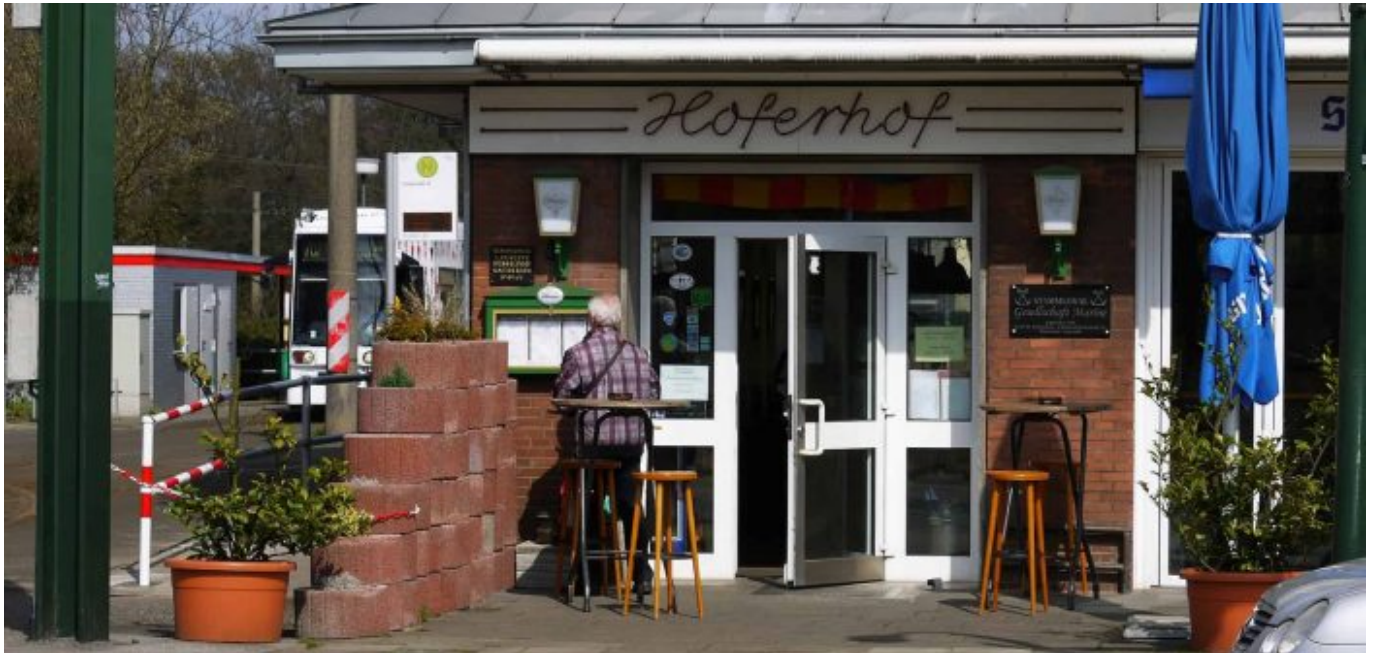
Hoferhof, die Kneipe an der Wendeschleife in Unterrath

Jenseits der Heinrich-Ehrhard-Straße, die hier gleichzeitig B1 und B7 ist, geht es auf der Ulmenstraße hinein nach Derendorf; vorbei an dem ehemaligen Rheinmetall-Gelände und dem abgerissenen Knast, der „Ulmer Höh“ bis zum Spichernplatz. Dort biegt die Bahn Richtung Dreieck ab., wo die Kreuzkirche residiert. Nun geht es die Nordstraße entlang und dann auf die Kaiserstraße. Spektakulär die Vorbeifahrt am neuen Kö-Bogen hinterm Hofgarten. Über die Berliner Allee kommt man nach Friedrichstadt, wo die 705 über die Hüttenstraße nach Oberbilk fährt. Parallel zum Volksgarten mit der Mitsubishi-Elektrik-Halle (die bei echten Düsseldorfer*innen immer noch „Philipshalle“ heißt...) führt die Route dann auf die Karl-Geusen-Straße, der Verbindung von Oberbilk über Lierenfeld nach Eller.