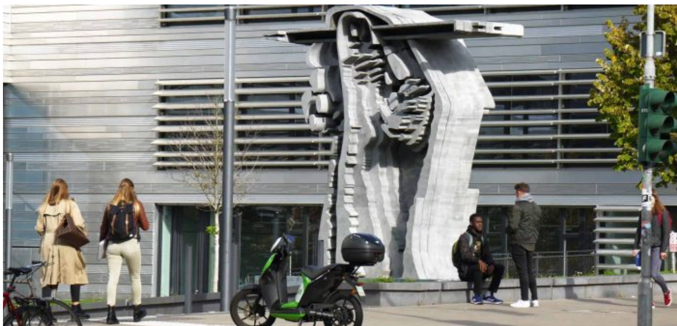
Hochschule Düsseldorf, Eingang Münsterstraße

Da hat man einen großen Teil des Düsseldorfer Südens schon gesehen. Nachdem die Bahn den Benrather Schlossweiher umrundet hat, kommt sie wenig später an der „Schönen Aussicht“ vorbei; ganz nah am Rhein bietet sich ein feiner Blick über den Flussbogen bis hinüber zur Urdenbacher Kämpfe. Die U71 kreuzt dann die Stadtteile Holthausen und Wersten und erlaubt so den Blick auf ein Düsseldorf fernab von Schickmicki. Dann geht es zwischen Uni-Gelände und Südpark hindurch nach Bilk bis zum Karolingerplatz, wo es gilt, die 701 zu erwischen.