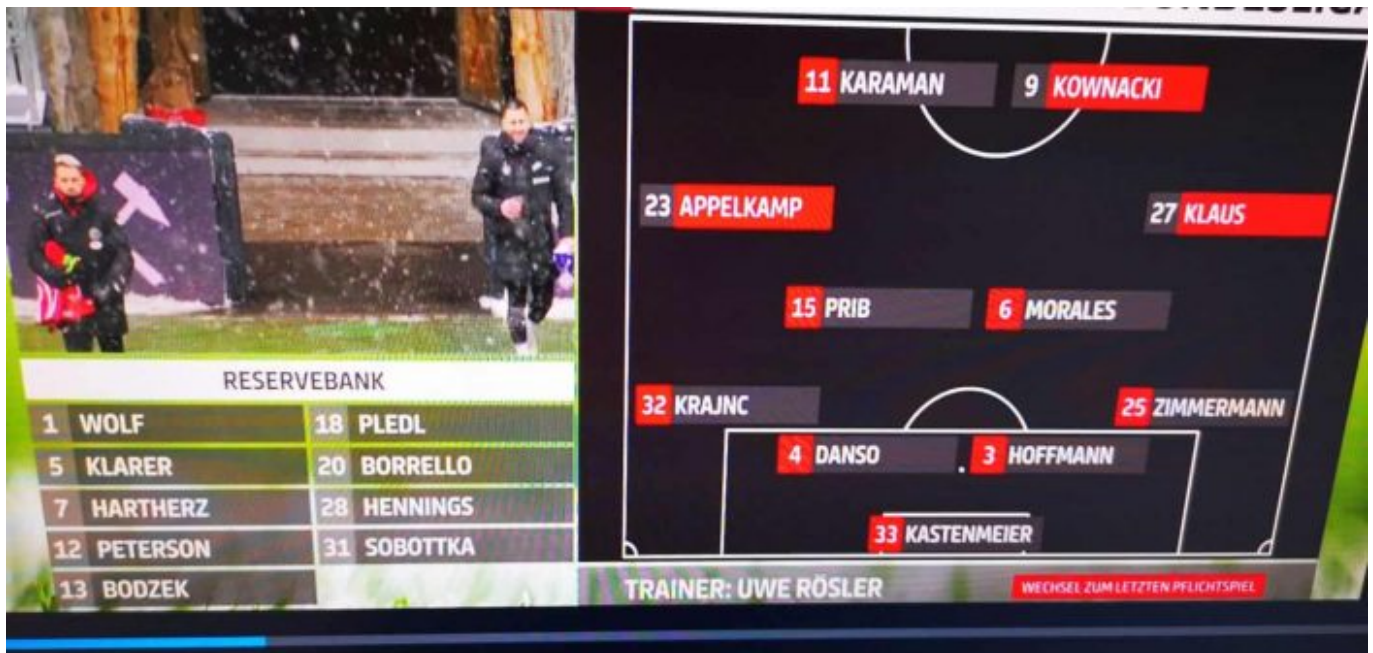
Aue vs F95: Sehr schöne Startaufstellung