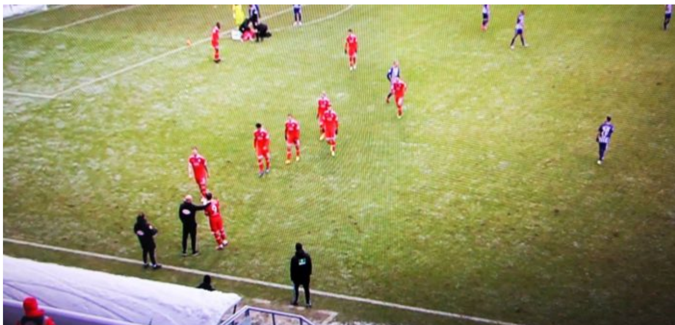
Aue vs F95: Kurze Besprechung vor den Wechseln (Sky-Screenshot)