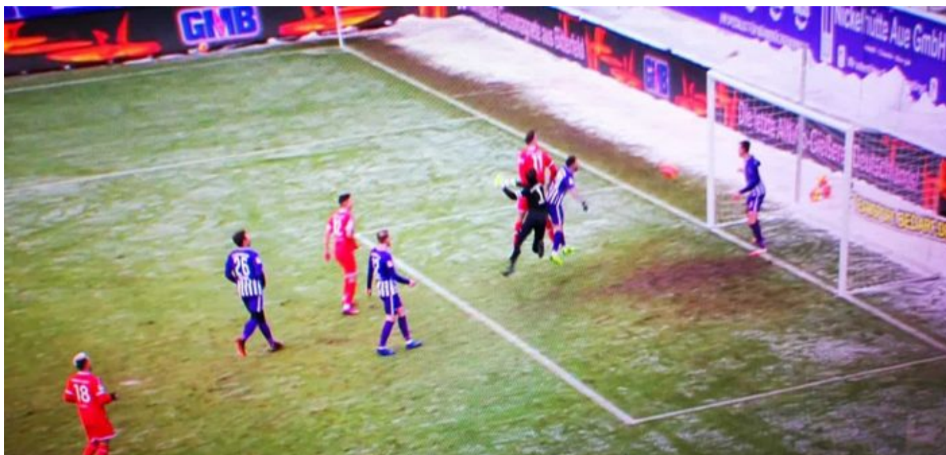
Aue vs F95: Karaman willensstark beim 2:0

Nicht selten schüttelt die interessierte Fortuna-Gemeinde kollektiv den Kopf angesichts der Wechseleien des Herrn Rösler. Gestern nicht. Erstens war es bemerkenswert, dass UR seine Burschen während einer Spielunterbrechung an die Linie rief, um eine kleine Mannschaftssitzung abzuhalten. In der hat er (hört man von Leuten, die dabei waren) die Kicker auf die anstehenden Auswechslungen vorbereitet und ihnen gleich mitgegeben, was sich danach ändern sollte. So kamen in der 70. Minuten auf einen Haufen Rouwen Hennings, Tony Pledl und Kristoffer Peterson rein – positionsgenau Wechsel, aber von der Art, die das Spiel noch einmal deutlich ändern.