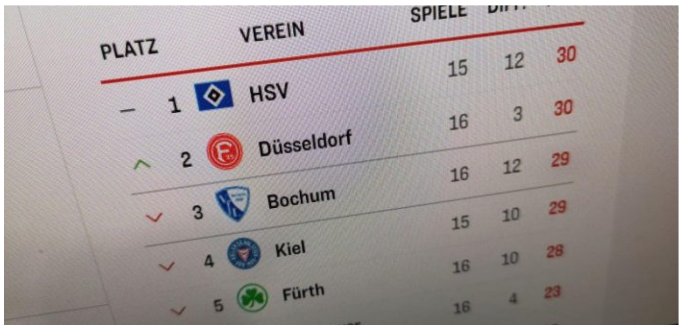
Aue vs F95: Eine wunderbare Momentaufnahme...