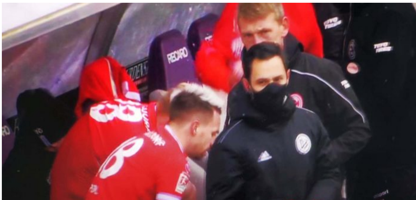
Aue vs F95: Der Dreifachwechsel in der 70.

Ist ja auch alles okay, wenn die Aufsicht übers Kampfgeschehen in den Händen eines ausgezeichneten Referees liegt wie die des Herrn Günsch, der von sich selbst übrigens sagt, er sei ein „Instinktschiedsrichter“. Von der Sorte, die richtig was vom Fußball verstehen und unterscheiden können, was Zweikampf und was Foul ist, hätten man gern mehr, viel mehr sogar. Gestern machte er es möglich, dass ein durchaus hart geführtes Match durchgehend fair blieb, dass die Spieler beider Seiten korrekt miteinander umgingen und das blödes Reklamieren und Meckern ausblieb. So gehen Zweitligaspiele, und die Stuhlkissenfurzer in der kölschen VAR-Zentrale können sich raushalten