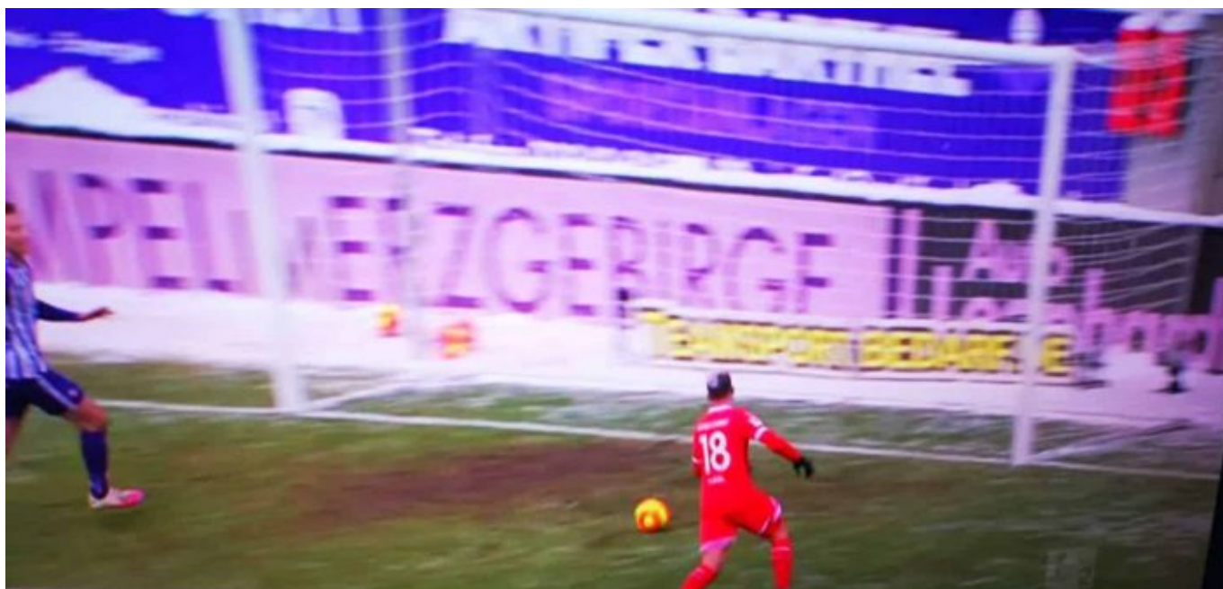
Aue vs F95: Pledl sicher zum 3:0

Das war nun also das siebte Spiel ohne Niederlage nacheinander. Macht insgesamt 19 Punkte und bis morgen schonmal Platz 3. Zwischenzeitlich, Bochum lag zurück, konnten sich Fortuna-Fans sogar an einer Momentaufnahme erfreuen, die F95 als Zwoten zeigte. Daran wird zu arbeiten sein, zumal es nun gegen Mannschaften geht, mit denen die Rotweißen direkt konkurrieren: Erst gegen Fürth und dann gegen Hamburg. Dafür müssen die Kicker, die Coaches und die Insassen des Funktionsteams nicht mal reisen, denn es handelt sich um das, was man früher „Heimspiele“ nannte.