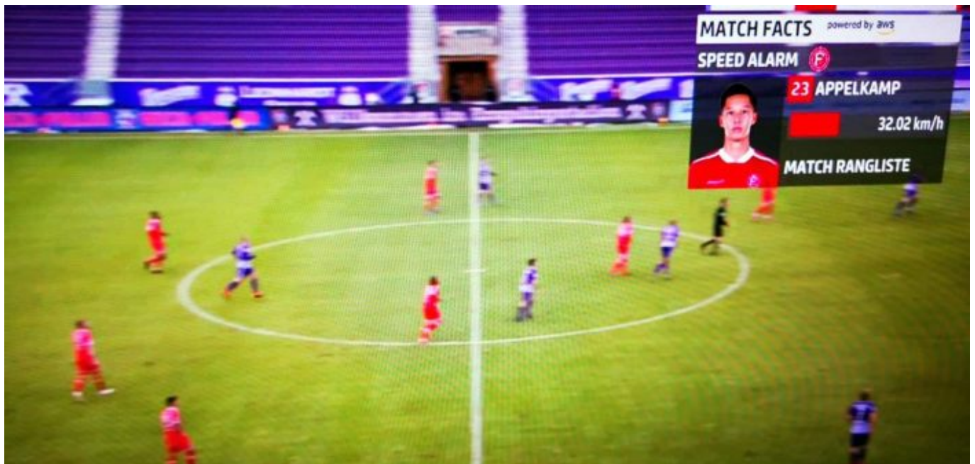
Aue vs F95: Shinta schnellster Mann

Geübt haben sie aber offensichtlich Zweikampfhärte. Das hätten die fehlgeleiteten Schiris der ersten Spieltage unseren Jungs ja beinahe ausgetrieben, dass Fußball auch zu den Martial Arts gehört. Klar, wenn man schon Gelb kassiert, weil man den Gegner böse anguckt, dann hält man sich zurück. Nun war der turbanisierte Auer, der zudem auch noch was am Muskel hatte und ausgewechselt werden musste, kein Opfer übertriebener Härte, sondern eher ein Pechvogel. Aber die Art und Weise wie Danso dann in den Luftkampf ging, hatte schon etwas Britisches.