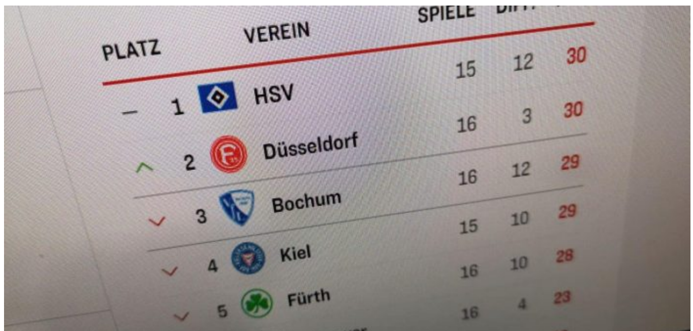
Aue vs F95: Eine wunderbare Momentaufnahme...

Und trotzdem: Es war nicht alles Champagner, was da auf den Schneeflocken serviert wurde. Nach der Pause vergaßen die Burschen in Rot, den Druck zu erhöhen, um das sichernde 2:0 zu machen. Beinahe schien es so, als hätten sie sich wieder eingelullt. Wieder wurde mit Vorliebe hinten herum gespielt, anstatt das feine und vielfältige Passspiel nach vorne zu treiben - es gab ja in der ersten Halbzeit sogar ein halbes Dutzend schicker Doppelpässe. Ähnlich wie in Braunschweig wäre es wieder typisch Fortuna gewesen, wenn sie sich in dieser Schlumpfphase eine Hütte gefangen hätten und dann ums Unentschieden hätten kämpfen müssen. Schönen Dank an Morales und die Viererbande hinter ihm, die dergleichen verhinderten.