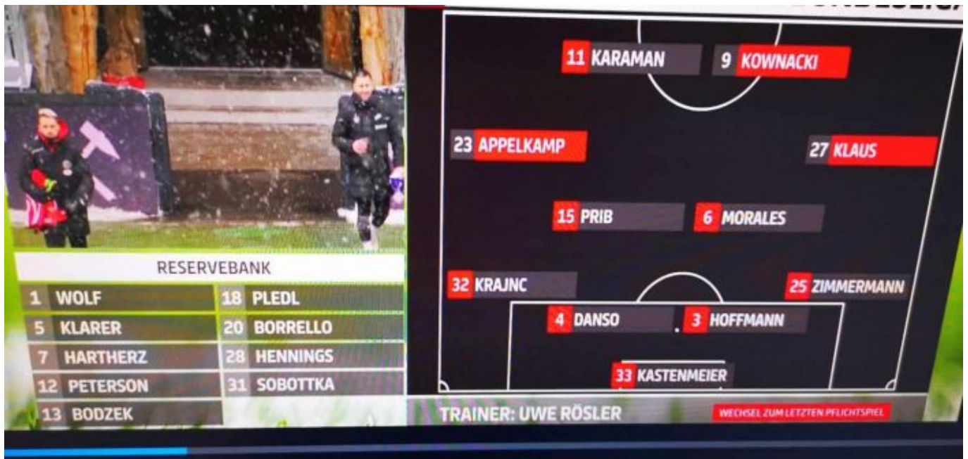
Aue vs F95: Sehr schöne Startaufstellung