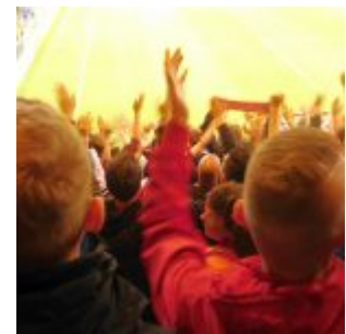
Bielefeld vs F95 1:3 - Siegesjubiläum