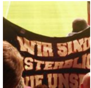
Wir sind unsterblich