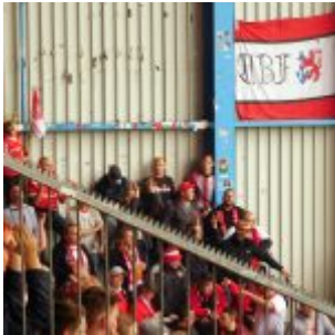
In der Wellblechecke