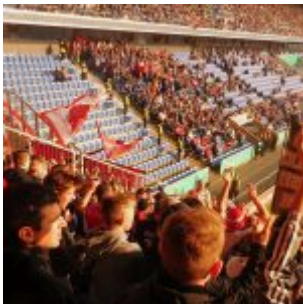
In der Sonne (zwischendurch)