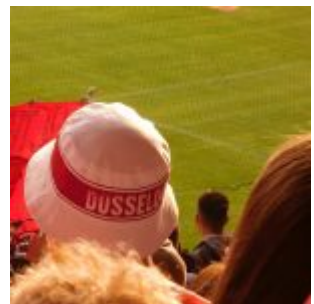
Der legendäre Fischerhut