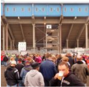
Draussen vor der Alm