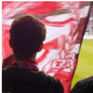
Vor der Fahne