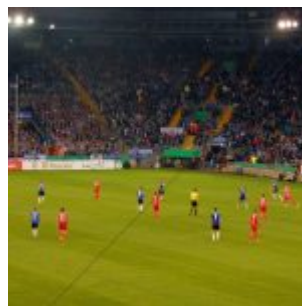
F)% greift an