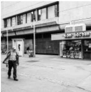
Am Kom(m)ödchen