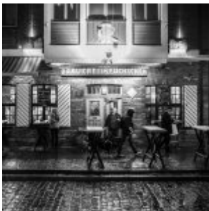
Bilder der KW22: Brauerei im Füchschen