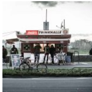
Das Fortunabüdchen am Rhein