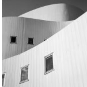
Bild der KW48: Schauspielhaus