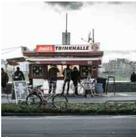
Das Fortunabüdchen am Rhein