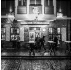
Bilder der KW22: Brauerei im Füchschen