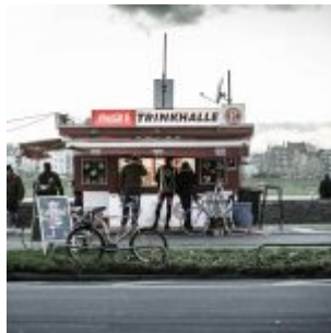
Das Fortunabüdchen am Rhein