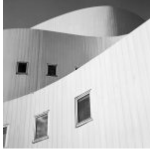
Bild der KW48: Schauspielhaus