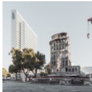
Platz 5: Schadowstraße (Markus Luigs)