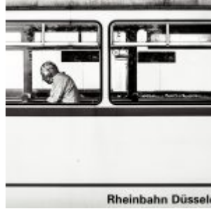
Platz 2: Rheinbahn (Markus Luigs)