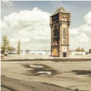
Platz 4 Wiesenstraße (Markus Luigs)