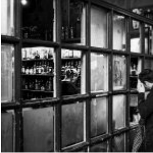
Das Ausschankfenster „Em Kabüffke“