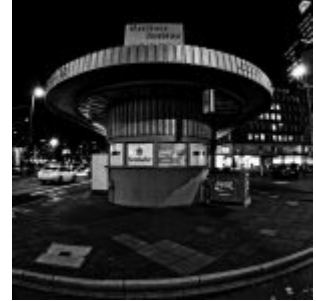
Platz3: Berliner Imbiss (Matthias Neugebauer)