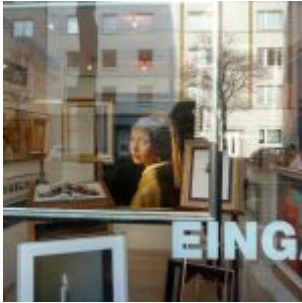
Platz 10: Mädchen mit den Perlenohrringen (Rainer Bartel)

Achtung: Die Preisübergabe am 2. März fällt leider aus.