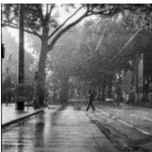
Platz 7: Bei Regen (Max Brugger)