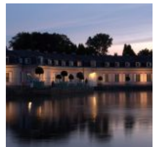
Der Benrather Schlossweiher in der Abenddämmerung