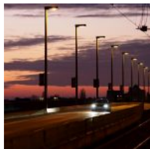
Platz 8: Oberkasseler Brücke (Hajo Kendelbacher)