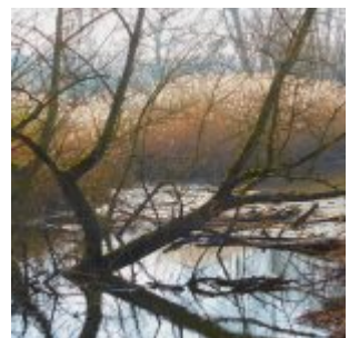
In der Kämpe