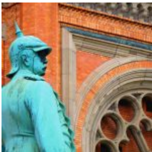
Bismarck an der Johanneskirche