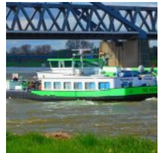
Grün ist die Hoffnung