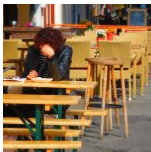
Pommes essen, Hunsrückstraße