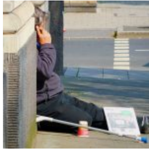
Fiftyfifty-Verkäufer auf der Kö