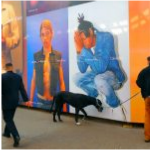
Stelle markieren, Kö