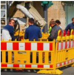
Pause, Benrather Straße