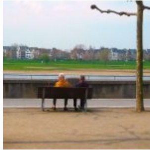
Auf der Bank, Rheinpromenade