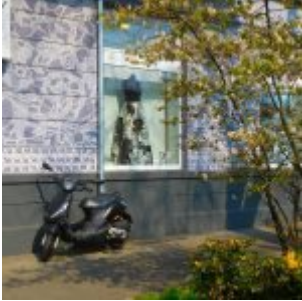
Das Abendkleid, Oberbilker Alle