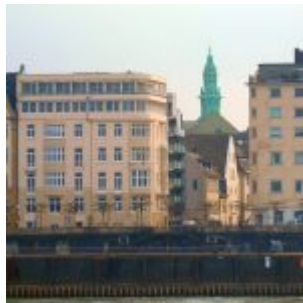
Das Türmchen des Stahlhofs ist von weither sichtbar – auch von der linken Rheinseite aus