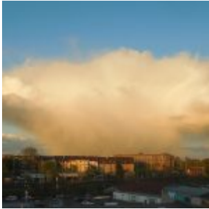
Atomwolke über Oberbilk