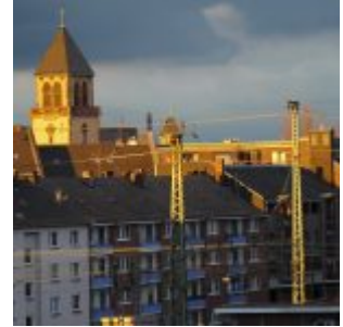
St. Apollinaris in der Sonne