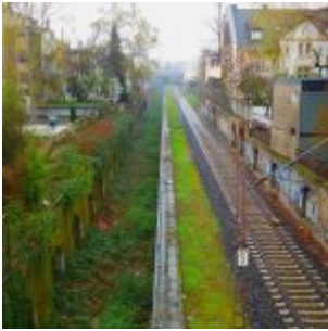
Eingleisig, Erkrather Straße