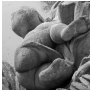
Am Arsch, Triton-Brunnen