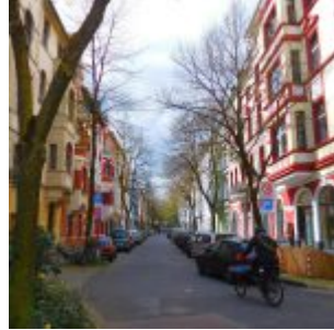
Die Hilde (brandstraße)