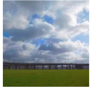
Wolken über der Kniebrücke