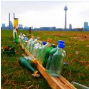
Fläschchen am Rhein