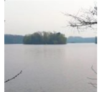
Insel im See