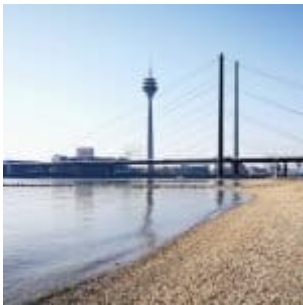
Winter am Paradiesstrand