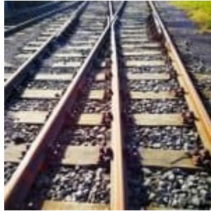
Gleise im Hafen