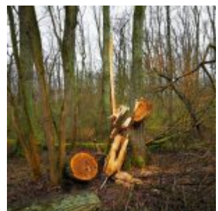
Bruch (Eller Forst)