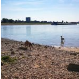
Hund im Rhein