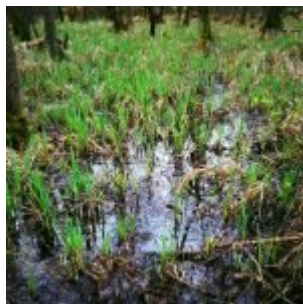
Sumpf (Eller Forst)