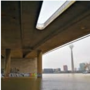
Erinnerung: Hochwasser unter der Kniebrücke