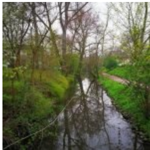
Frühling an der Düssel