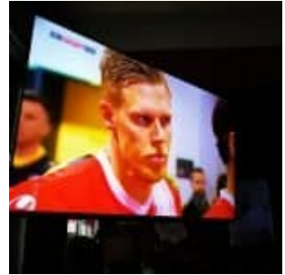
Aufstiegsheld vor Spielbeginn

Auf der Facebook-Seite von The Düsseldorf veröffentlichten wir jeden Tag ein Bild aus Düsseldorf. Und weil so viele Leserinnen und Leser diese Fotos mögen, sammeln wir die Bilder eines Monats und veröffentlichen sie noch einmal hier als Album. Dies sind die Bilder aus dem April 2018.