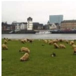
Schafe vor Oberkassel