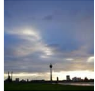
Himmel über dem Turm