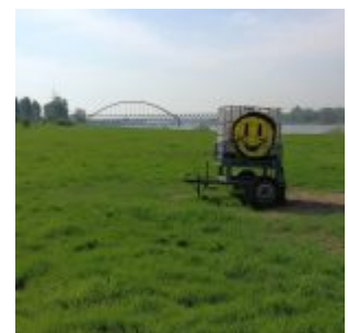
Smilie auf der Lausward