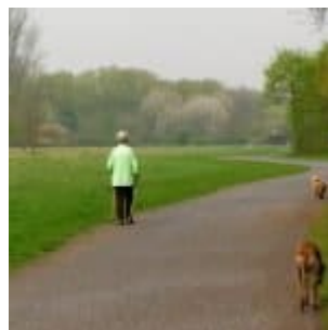
Grün in grün