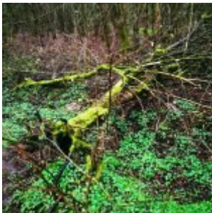
Insekt („Eller Märchenforst“)