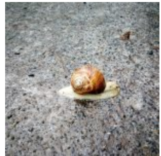
Schnecke im Regen