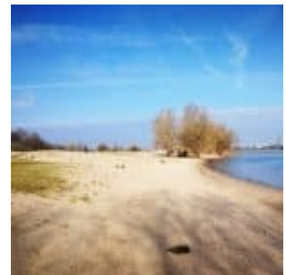
Der weite Strand