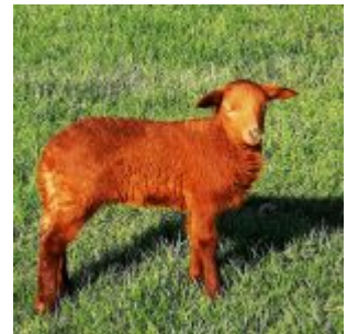
Osterlamm auf der Löricker Rheinwiese