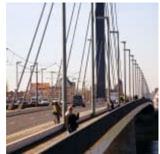
Über die Oberkasseler Brücke