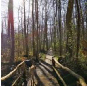
7-Brücken-Weg im Eller Forst