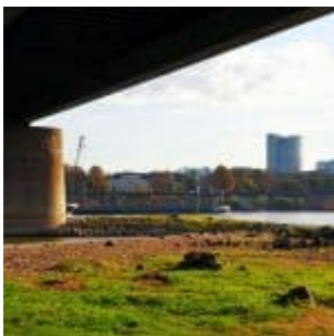
Unter der Theodor-Heuss-Brücke