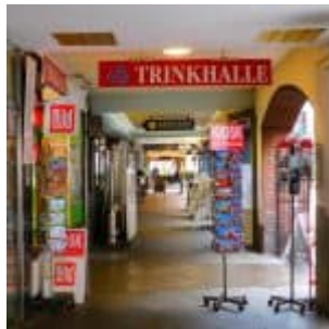
Büdchen an der Bolker Straße