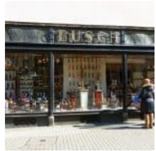
Busch, der Schnapsladen