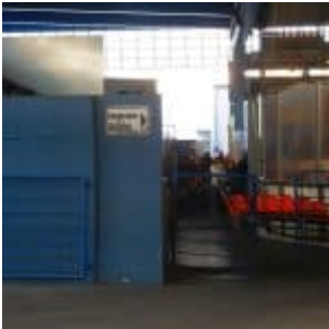
im Eisstadion an der Brehmstraße