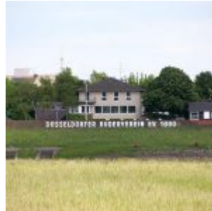
Düsseldorfer Ruderverein (2009)