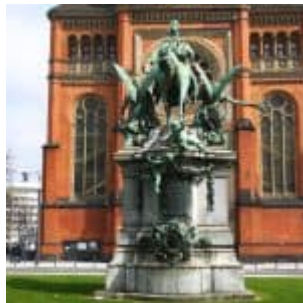
Kaiser von hinten