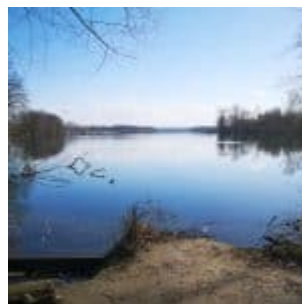
Unterbacher See frühmorgens