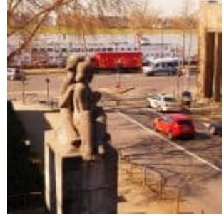
Blick zum Joseph-Beuys-Ufer