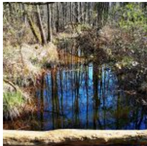
Blau im Eller Forst