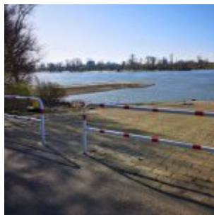
Panzerrampe unterhalb des Messegeländes