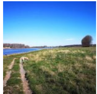
Friede am Rhein