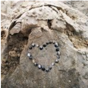
Sandburg bei Hamm