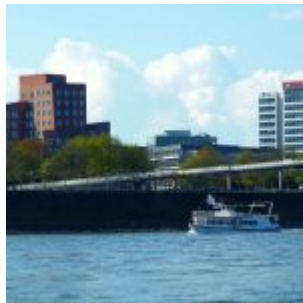
Weisse-Flotte-Schiffchen fährt aus (April 2011)