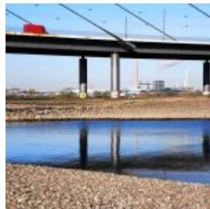
Über die Brücke drüber