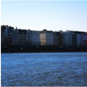
Der blaue Rhein