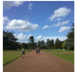
Im Nordpark 2012