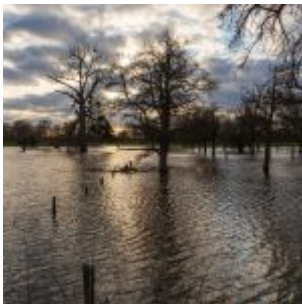
2020 Hochwasser in der Urdenbacher Kämpe