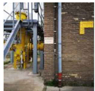
Pumpwerk im Hafen