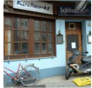
Kneipe „Kirchmarkt“ (2011)