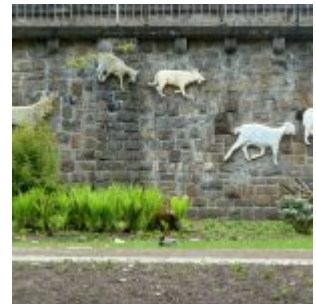
Wolf-und-Schafe-Reliefs im Volksgarten