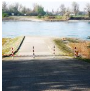
Rampe gesperrt... (Nähe Wasserwerk Am Staad; Startplatz der Jetski-Fahrer)