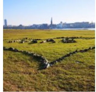
Bild aus dem April: Ein Herz fürs Dorf

[Anklicken zum Vergrößern] Auf der Facebook-Seite von The Düsseldorfer veröffentlichen wir jeden Tag ein Bild aus Düsseldorf. Und weil so viele Leserinnen und Leser diese Fotos mögen, sammeln wir die Bilder eines Monats und veröffentlichen sie noch einmal hier als Album. Dies sind die Bilder aus dem April 2020.