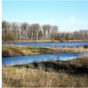
In der Kämpe