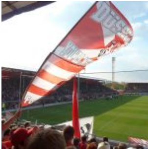
In der Lenarena 2011