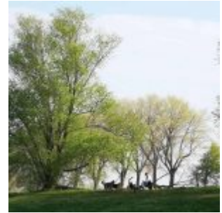
Hunderudelpause unter Bäumen