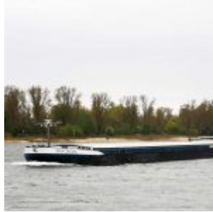
Vaya con dios auf dem Rhein