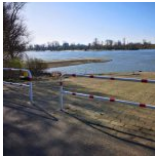
Panzerampe unterhalb des Messegeländes