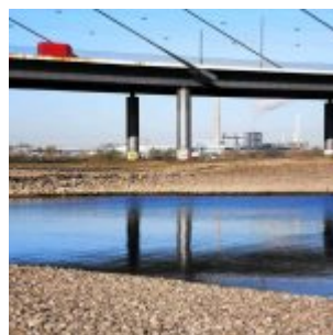
Über die Brücke drüber