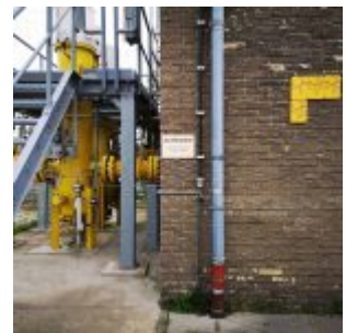
Pumpwerk im Hafen