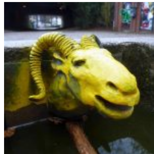
Wolf-und-Schafe-Brunnen an der Emmastraße