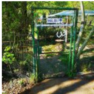
Malibu in Niederkassel