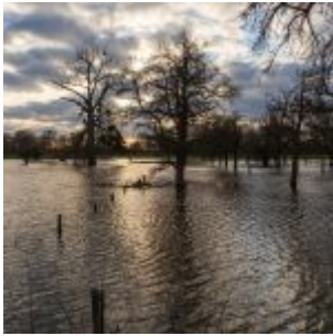
2020 Hochwasser in der Urdenbacher Kämpe