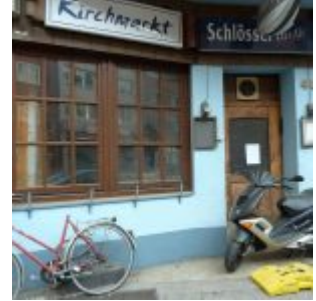
Kneipe „Kirchmarkt“ (2011)