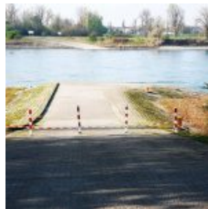
Rampe gesperrt... (Nähe Wasserwerk Am Staad; Startplatz der Jetski-Fahrer)