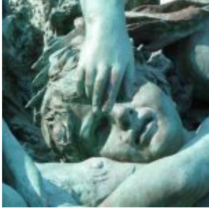
Vater Rhein und seine Töchter