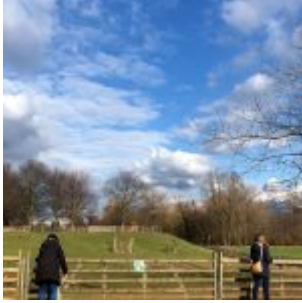
Am Kinderbauernhof im Südpark