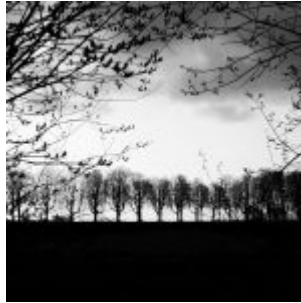
Auf dem Deich