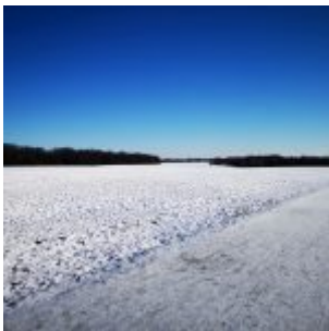
Segelflugwiese (Februar 2021)