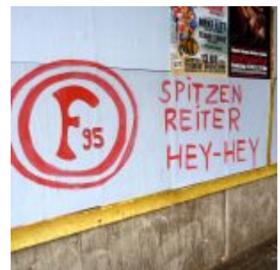
Spitzenreiter (November 2008)