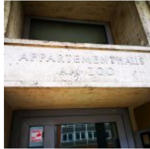
Appartementhaus am Zoo