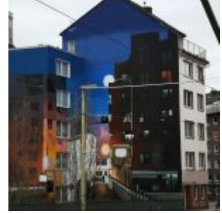
An der Zoobrücke

Im Instagram-Stream von The Düsseldorf veröffentlichten wir jeden Tag ein Bild aus Düsseldorf. Und weil so viele Leserinnen und Leser diese Fotos mögen, sammeln wir die Bilder eines Monats und präsentieren sie noch einmal hier als Album. Dies sind die Bilder aus dem April 2021.