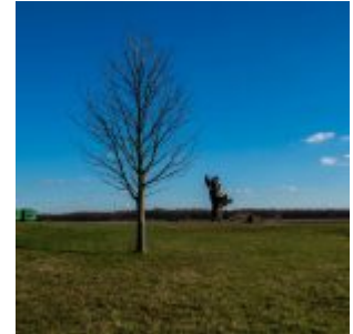
Zweimal Himmelgeister Kastanie