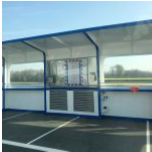
Auf der Fähre