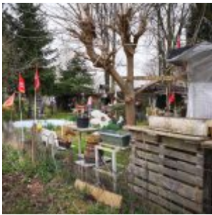
Kleingarten bei Niederkassel