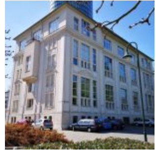
Atelierhaus Sittarder Straße