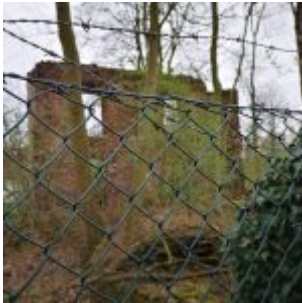
Ruine an der Buschermühle