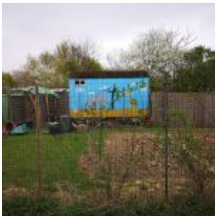
Bauwagen in Niederkassel