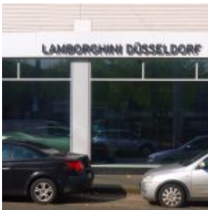
Lamborghini Düsseldorf, Rather Straße