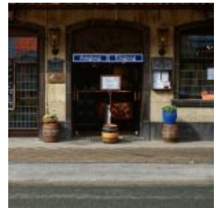
Schumacher Ost in Corona-Zeiten