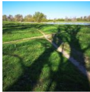
Kreuzweg in der Urdenbacher Kämpe