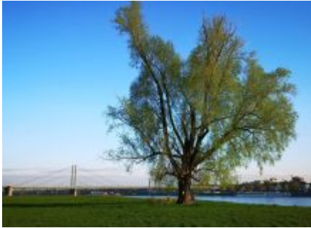
3. April 2022, 8:15Uhr, 0 Grad