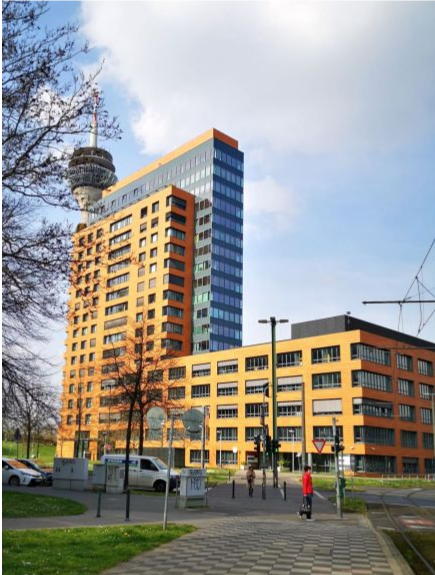
Portobello und Rheinturm