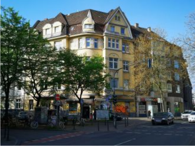
Volksgartenstraße Ecke Oberbilker Allee