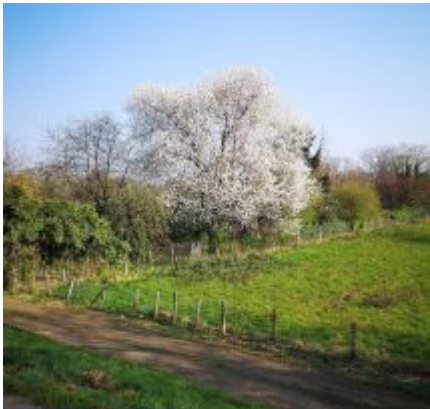
Frühling in Niederkassel