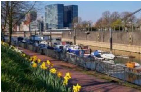
Frühling an der Marina (A. Otto)