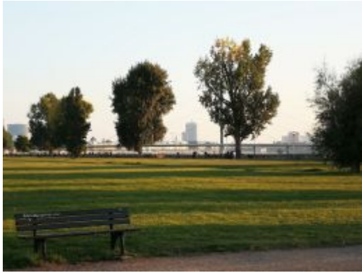
Im Rheinpark Golzheim