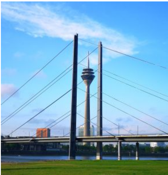
30 April 2022, 7:45 Uhr, 7 Grad