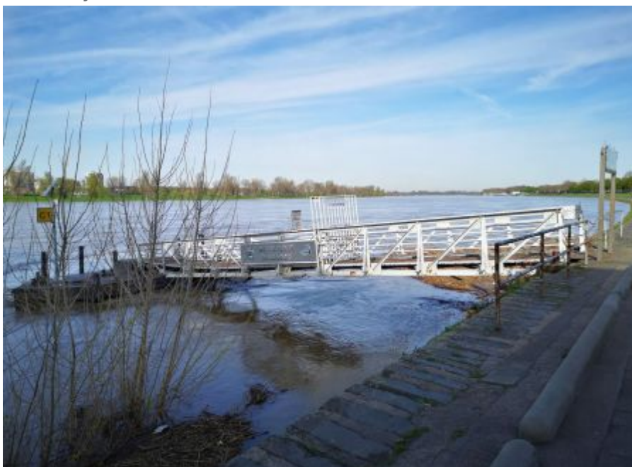
Steiger der Weissen Flotte

Im Instagram-Stream von The Düsseldorf veröffentlichen wir jeden Tag ein Bild aus Düsseldorf. Und weil so viele Leserinnen und Leser diese Fotos mögen, sammeln wir die Bilder eines Monats und präsentieren sie noch einmal hier als Album. Dies sind die Bilder aus dem April 2022.