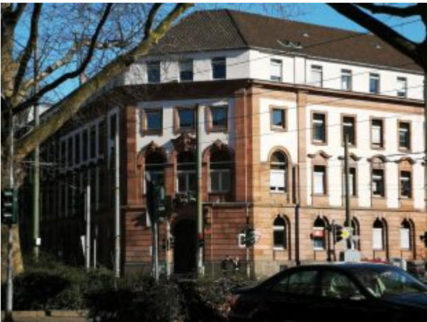
Polizeigebäude am Ernst-Reuter-Platz