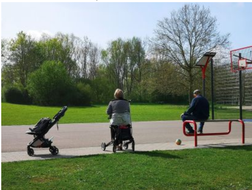
Pause im Nachbarschaftspark Am Hackenbruch