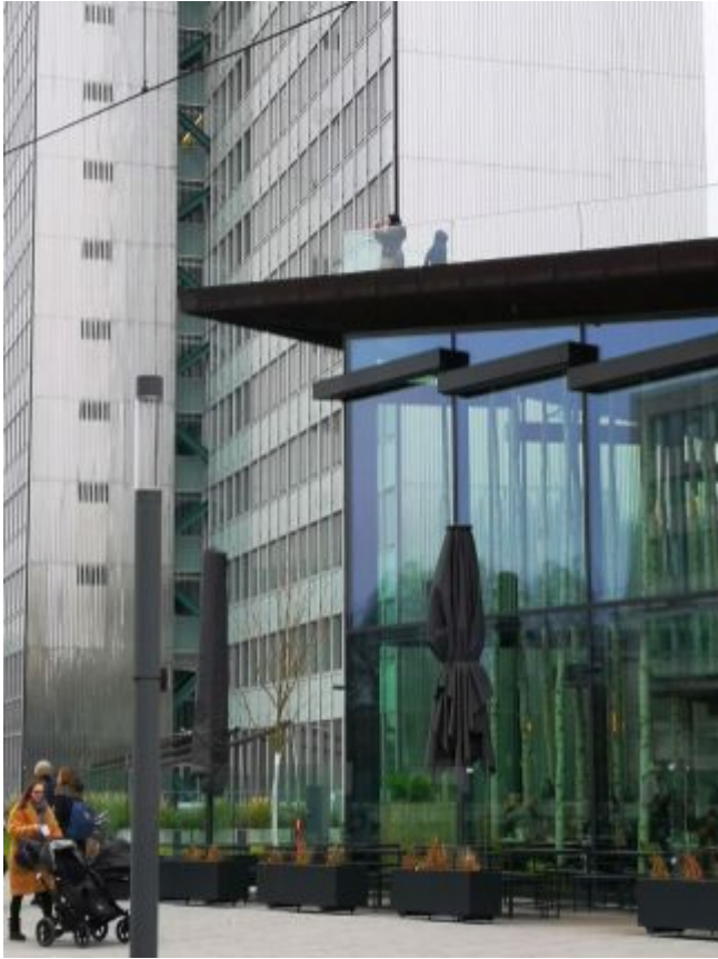
Kö-Bogen und Dreischeibenhaus