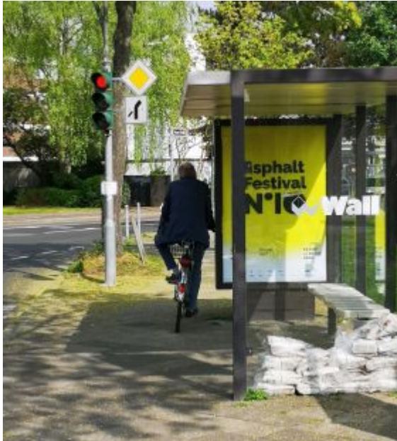
Haltestelle in Lierenfeld