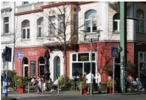
Musame am Fürstenplatz