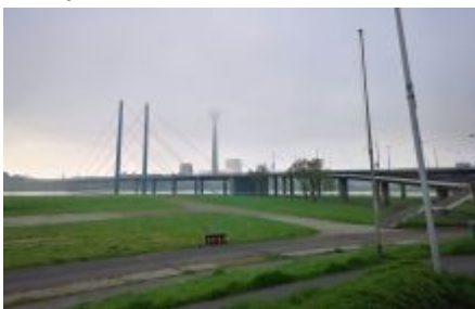
16. April 2022, 8:30 Uhr, 8 Grad