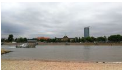
Blick über den Rhein