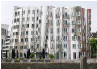
Gehry in Blech