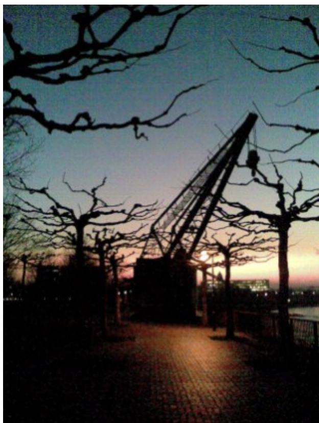
Hafenkran am Landtag (ca. 2011)