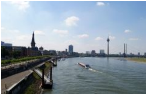
Das schönste Panorama der Welt