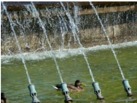
Pullentchen im Nordpark