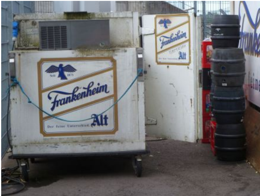
Bierwagen im Paul-Janes-Stadion