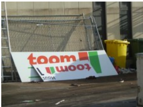
Toom an der Oberbilker Allee (Dezember 2011)