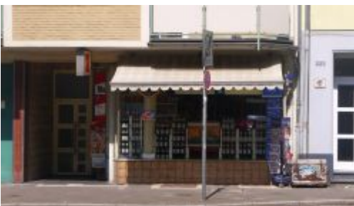
Unser Büdchen am Fürstenwall