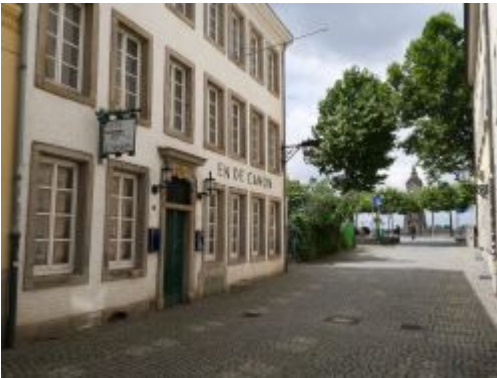
En de Canon - Traditionswirtshaus, leider verfallend