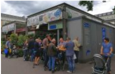
Mittagspause op'm Carlsplatz