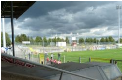
Fotografen im Paul-Janes-Stadion (2012)