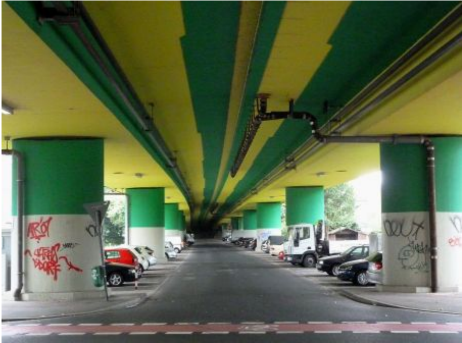
Unter der Brücke - Parkplatz in Heerdt