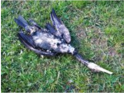
Toter Kormoran am Rheinufer