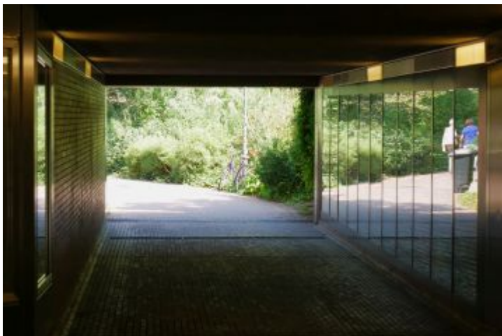
Passage zwischen Kunstakademie und Tonhalle