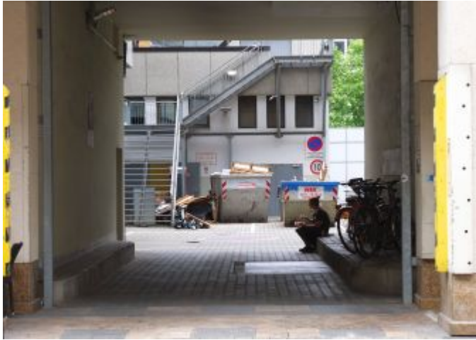
Pause (an der Grünstraße)