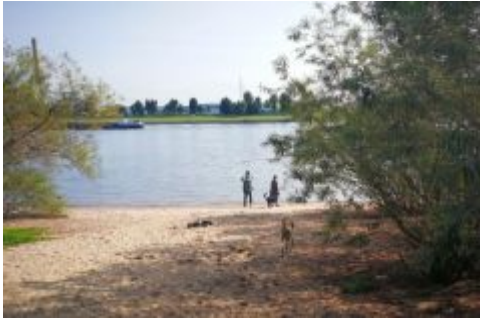
Am Strand (an der Ölgangsinsel)