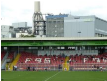
Das altherwürdige Paul-Janes- Stadion am Flinger Broich (ca. 2012)