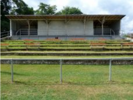
ESV-Stadion am Flinger Broich