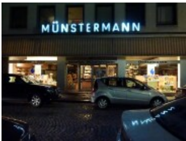
Münstermann auf der Hohe Straße (ca. 2010)