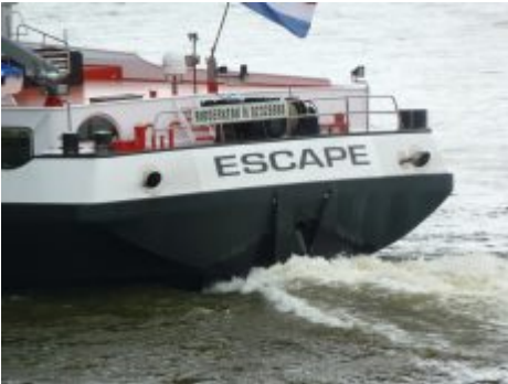
Escape auf dem Rhein