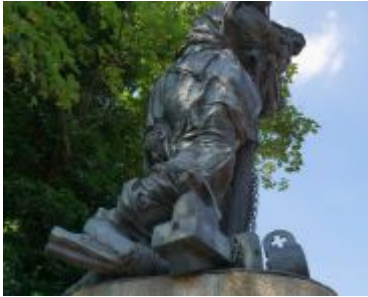
Nepomuk an der Oberkasseler Brücke