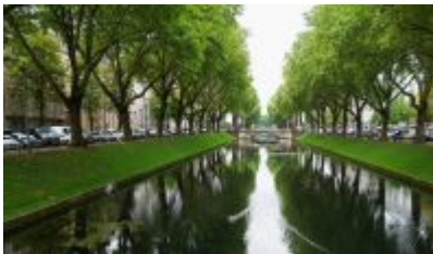
Kö-Graben mit Glitzer