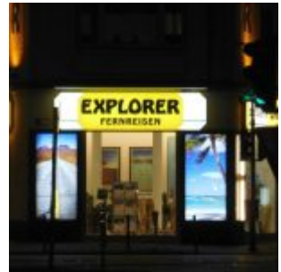
Explorer Fernreisen am Ernst-Reuter-Platz