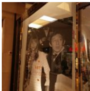
Gainsbourg – die Fresse