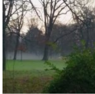
Bodennebel im Volksgarten