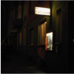
Theater Takelgarn auf der Phillip-Reis-Straße