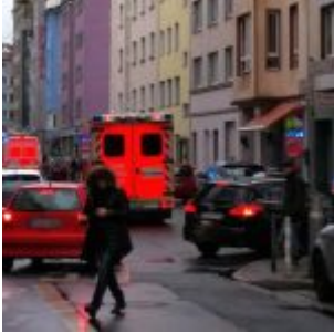
Feuerwehreinsatz in der Pionierstraße