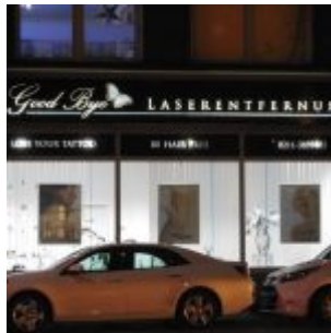
Good Bye Laserentfernung auf der Corneliusstraße