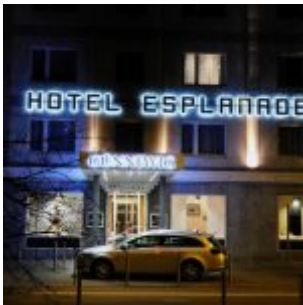
Hotel Esplanade am Fürstenplatz