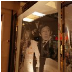
Gainsbourg – die Fresse