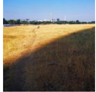
Sommer 2018: Dürre