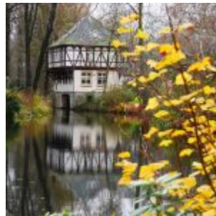
Am Schloss Eller; durch den Park fließt der Eselsbach, der auch den Schlossgraben speist