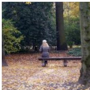
Allein an der Reiterallee