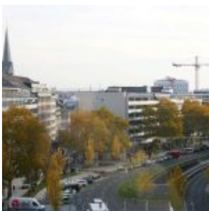
Blick in die Immermannstraße