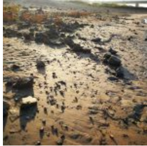
Steinstrand bei Hamm