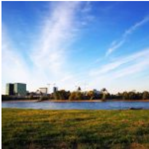
Drüben im Medienhafen