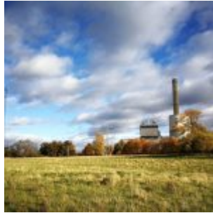
Ortsangabe: Lausward – die stille Ecke am Kraftwerk