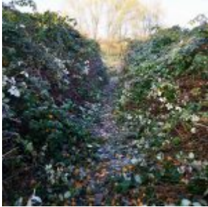
Brombeerschungel am Rhein