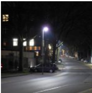
Fichtenstraße (ca. 2010)