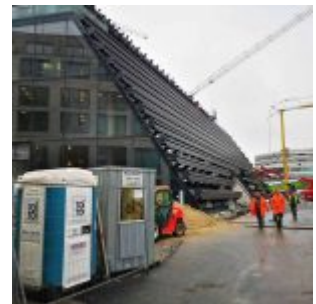
Ingenhoven-Tal im Bau