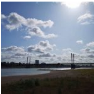
Blick auf die Theodor-Heuss- Brücke