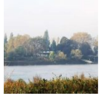
Blick nach Mönchenwerth