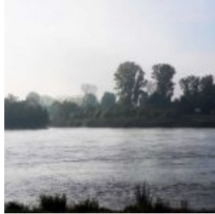
Einfahrt in den Paradieshafen bei Emmafisch, das Fischrestaurant Lörick