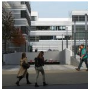
HSD, Einfahrt zur Tiefgarage