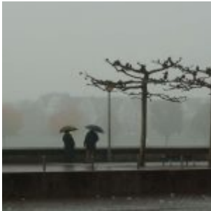
Regen an der Rheinuferpromenade (November 2012)