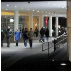
Passage am K20