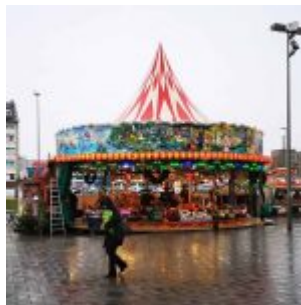
Fröhliche Weihnachten (an den Bilker Arkaden)

[Anklicken zum Vergrößern] Auf der Facebook-Seite von The Düsseldorfer veröffentlichen wir jeden Tag ein Bild aus Düsseldorf. Und weil so viele Leserinnen und Leser diese Fotos mögen, sammeln wir die Bilder eines Monats und veröffentlichen sie noch einmal hier als Album. Dies sind die Bilder aus dem Dezember 2019.