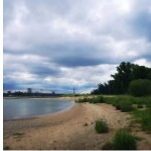
Löricker Bucht (Sommer 2019)