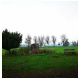
Die Schmittmann-Bank bei Lörick