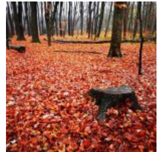
Herbst im Eller Forst