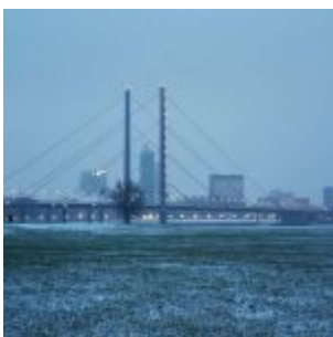
Schnee am 1. Januar 2021

Im Instagram-Stream von The Düsseldorfer veröffentlichen wir jeden Tag ein Bild aus Düsseldorf. Und weil so viele Leserinnen und Leser diese Fotos mögen, sammeln wir die Bilder eines Monats und präsentieren sie noch einmal hier als Album. Dies sind die Bilder aus dem Januar 2021.