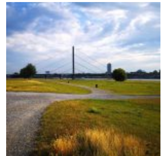
Oberkasseler Rheinwiese im Spätsommer 2020