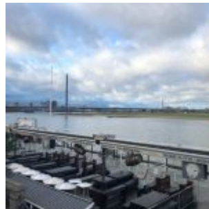
Kasematten im Lockdown