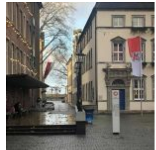
Am Marktplatz im Lockdown