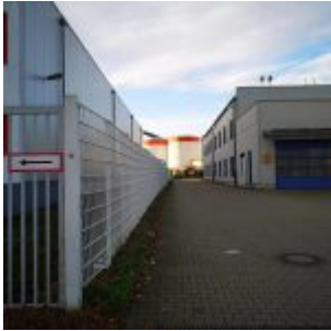
2 Tanks im Hafen