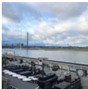
Kasematten im Lockdown