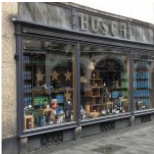
Busch im Lockdown