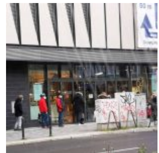
Schlange bei Edeka Zurheide