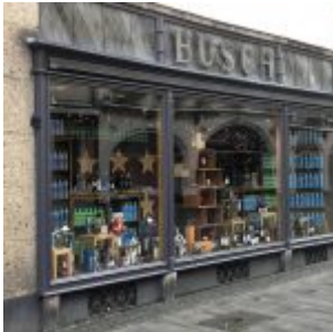
Busch im Lockdown