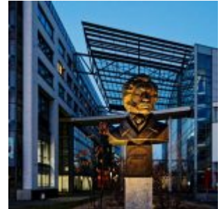
Puschkin am Oberbilker Markt