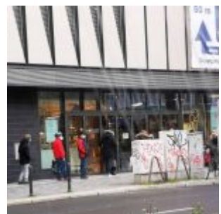
Schlange bei Edeka Zurheide