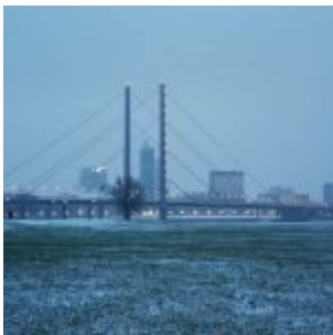
Schnee am 1. Januar 2021

Im Instagram-Stream von The Düsseldorfer veröffentlichen wir jeden Tag ein Bild aus Düsseldorf. Und weil so viele Leserinnen und Leser diese Fotos mögen, sammeln wir die Bilder eines Monats und präsentieren sie noch einmal hier als Album. Dies sind die Bilder aus dem Januar 2021.