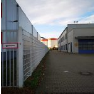
2 Tanks im Hafen