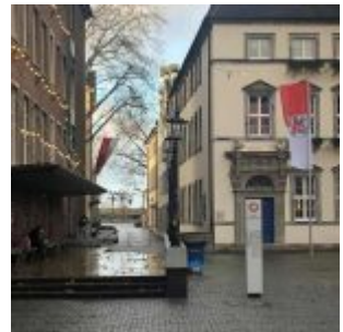
Am Marktplatz im Lockdown