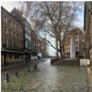
Uerige im Lockdown