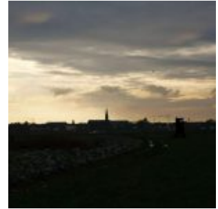
Sonnenaufgang über der Stadt