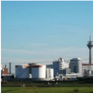
Blick über den Hafen