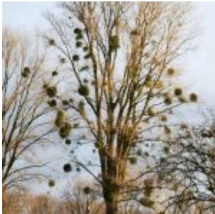
Misteln in der Urdenbacher Kämpe