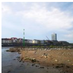
Blick zum Mannesmannufer