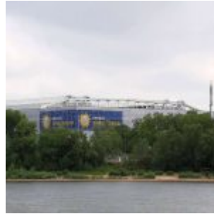
Blick rüber zur Arena