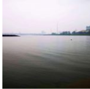
Vater Rhein im Dunst