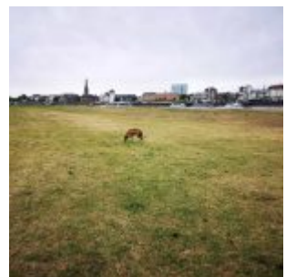
Wiese mit Hund