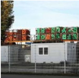
Baustoffhandel im Hafen