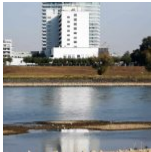
Neue Scheußlichkeit in Heerdt