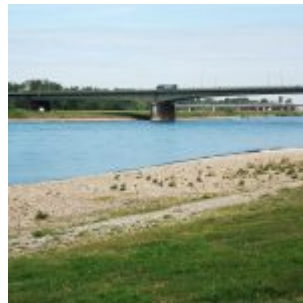
Blick zur Südbrücke