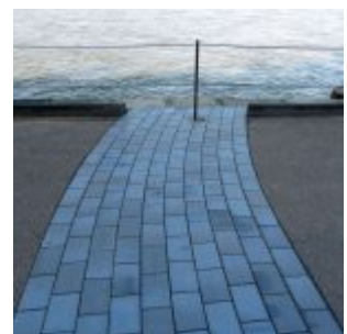
Die Mündung der südlichen Düssel am Unteren Rheinwerft