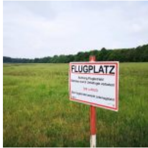
Flugplatz oben auf dem Aaper Wald