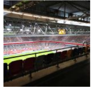
Ganz leer, die Arena