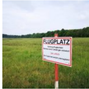
Flugplatz oben auf dem Aaper Wald