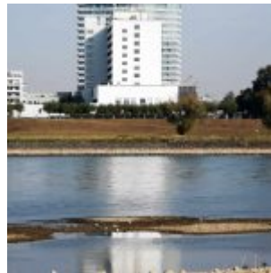
Neue Scheußlichkeit in Heerdt