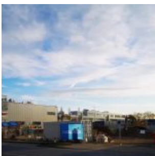
Neubau im Hafen