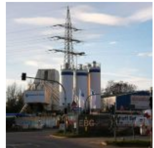
Betonfabrik im Hafen