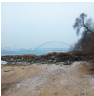
Bis zur Hammer Eisenbahnbrücke