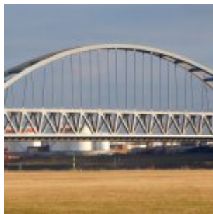
Hammer Eisenbahnbrücke, das ultimative Porträt