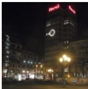
Das Haus, das nach dem großen OB Wilhelm Marx benannt wurde, bei Nacht