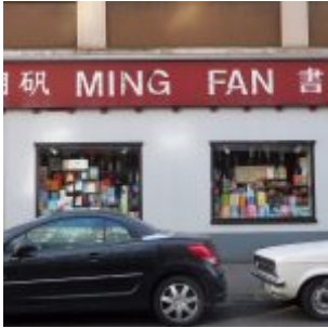
Kulturladen Ming Fang