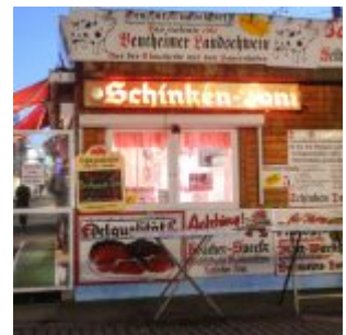
Schinken-Toni auf dem Carl'splatz