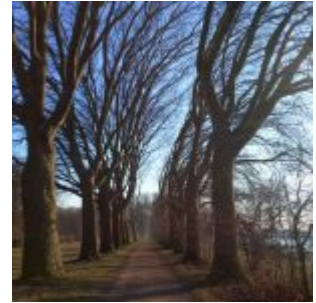
Schönste Allee, Am Staad