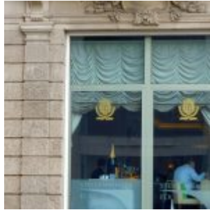
Sektfrühstück im Parkhotel