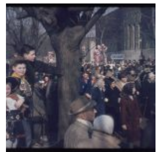
Dä Zoch kütt (ca. 1962)