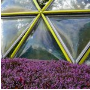
Geodätische Kuppel im Botanischen Garten (Achim Otto)