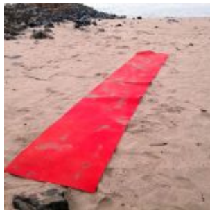
Roter Teppich am Paradiesstrand