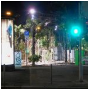
Dschungel am Erst-Reuter-Platz