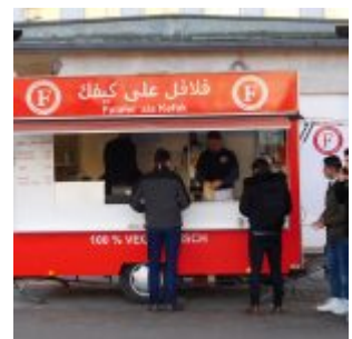
Kefak Falafel am Stresemannplatz