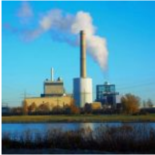
Kraftwerk Lausward in der Kälte