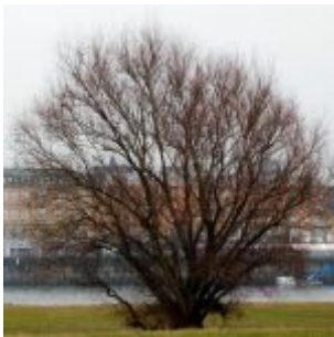
Baum vor Altstadt