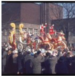
Prinzenwagen (ca. 1962)