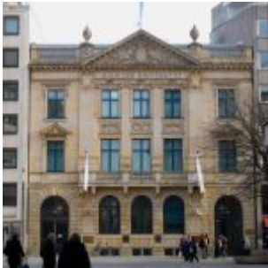
Haus der Universität am Schadowplatz