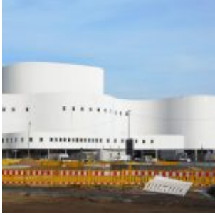
Freier Blick aufs Schauspielhaus

Auf der Facebook-Seite von The Düsseldorfer veröffentlichen wir jeden Tag ein Bild aus Düsseldorf. Und weil so viele Leserinnen und Leser diese Fotos mögen, sammeln wir die Bilder eines Monats und veröffentlichen sie noch einmal hier als Album. Dies sind die Bilder aus dem Februar 2017.