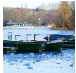
Unterbacher See, zugefroren (Achim Otto)