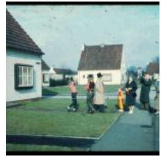
Jecke Düsseldorf in Waldniel (ca. 1959)