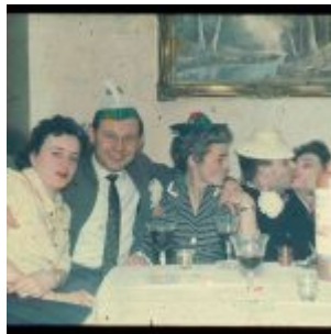
Karneval privat (ca. 1960)