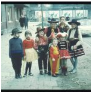
Pänz zu Karneval op dä Corneliusstrooß (Foto: ca. 1959, privat/TD)