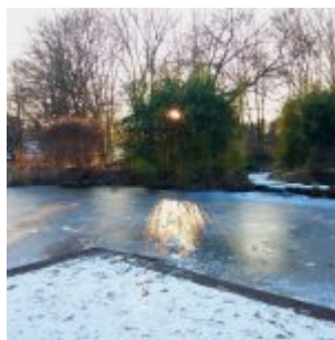
Eis im Südpark