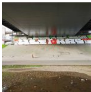
Unter der Oberkasseler Brücke