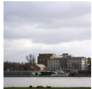
Reuerkaserne und Kunstakademie