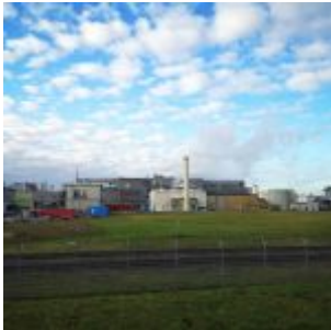
Klopapierfabrik im Neusser Hafen