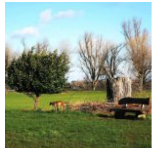
Schmittmann-Bank mit neuem Baum