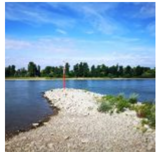
Landzunge (Sommer 2019)