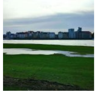
Ein bisschen Hochwasser