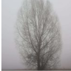
Baum im Nebel