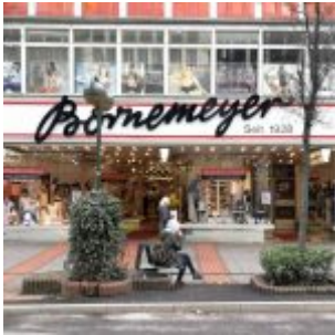
Ex-Bornemeyer (ca. 2017)