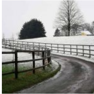
Schnee am Backesberg