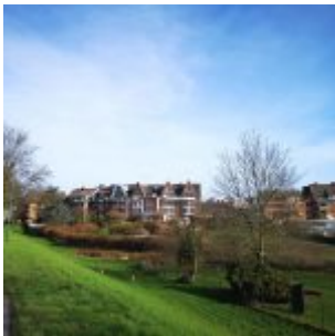
Südende von Hamm