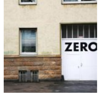
ZERO auf der Hüttenstraße

[Anklicken zum Vergrößern] Auf der Facebook-Seite von The Düsseldorf veröffentlichten wir jeden Tag ein Bild aus Düsseldorf. Und weil so viele Leserinnen und Leser diese Fotos mögen, sammeln wir die Bilder eines Monats und veröffentlichen sie noch einmal hier als Album. Dies sind die Bilder aus dem Februar 2020.