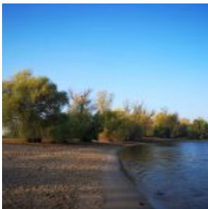
Lörickstrand (Sommer 2019)