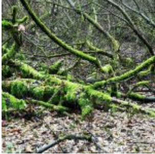
Moss im Forst