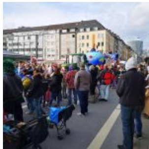
Rosenmontag am Kirchplatz (2018)